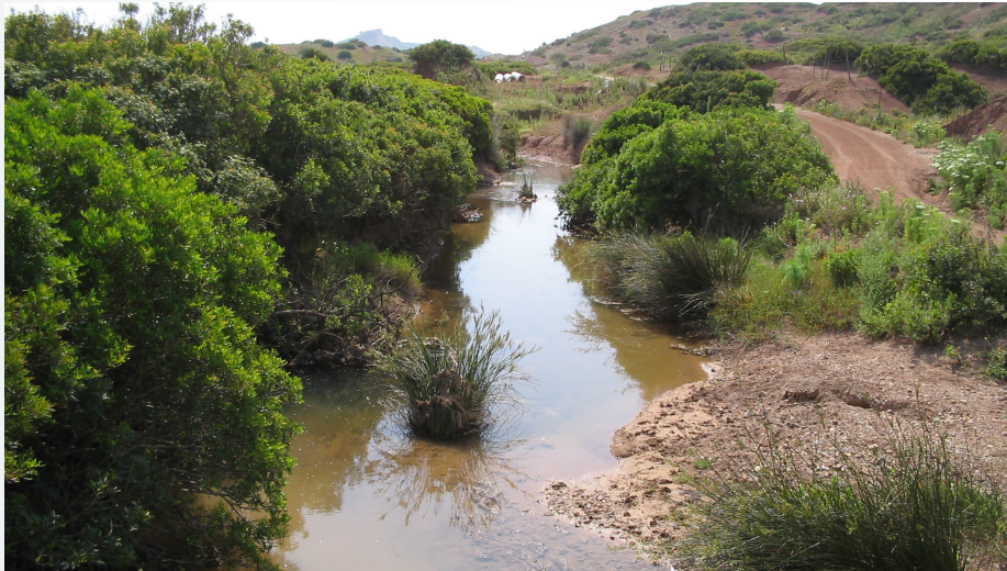
Arroyo Salado (río Iro). Autor: Antonio Luna del Barco