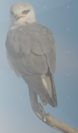
Elanio azul ( Elanus caeruleus ).