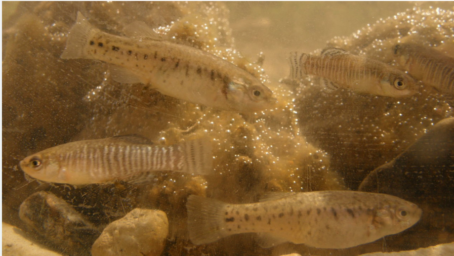
Salinete (Aphanius baeticus)