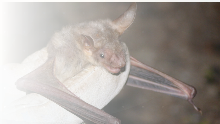
Murciélago ratonero mediano ( Myotis blythii ). Autor: José Manuel Méndez