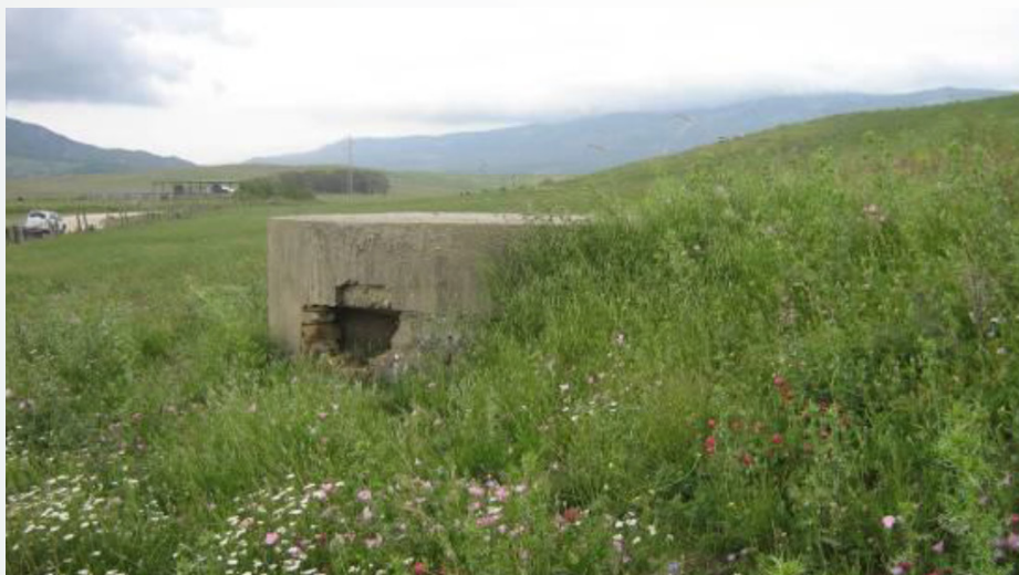
Troneras del búnker del Santuario de la Luz