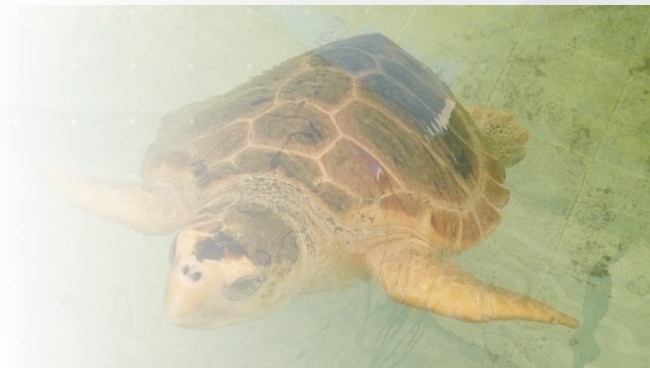
Tortuga boba ( Caretta caretta )