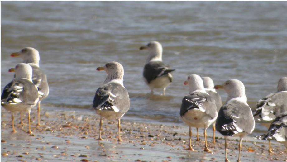
Gaviota sombría ( Larus fuscus ).