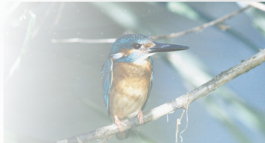
Martín pescador ( Alcedo Atthis ). Autores: Mila Olano y Javier Echevarri