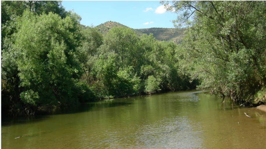
Río Cuzna aguas arriba.