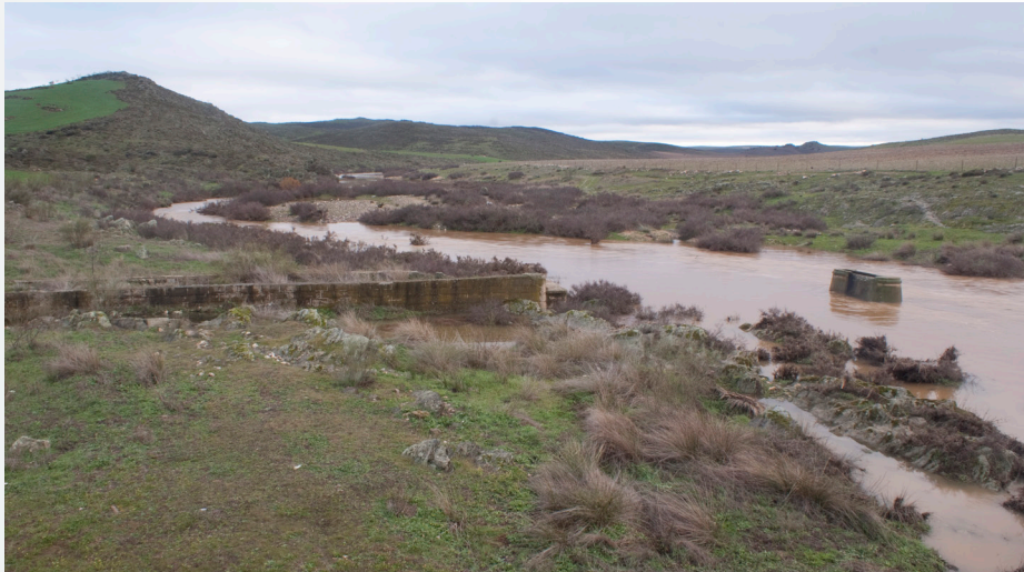
Río Guadamatilla.