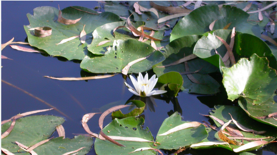
Nenúfar blanco ( Nymphaea alba ). Autor: Juan Luis Rendón