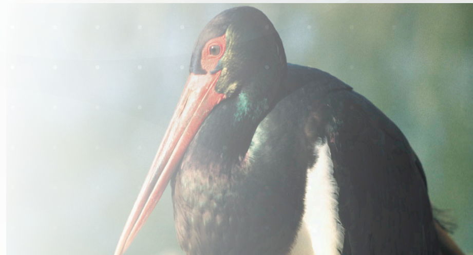
Cigüeña negra ( Ciconia nigra ).