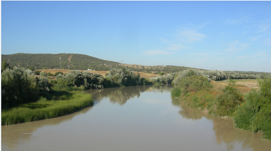
Tramo medio del río Guadalquivir. Autores: D. Cabello, T. de Diego, M.C. Martín y M.I. Cerrillo