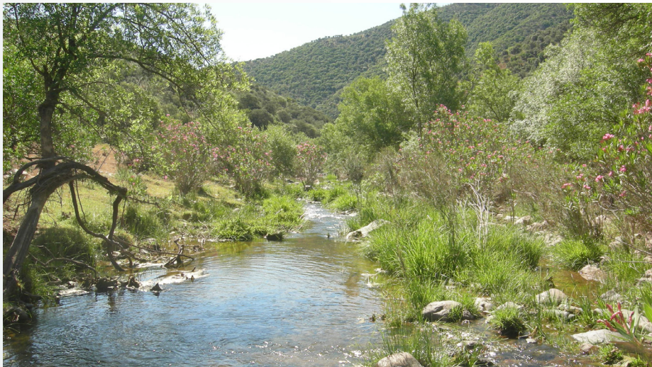
Cauce del río Guadalbarbo.