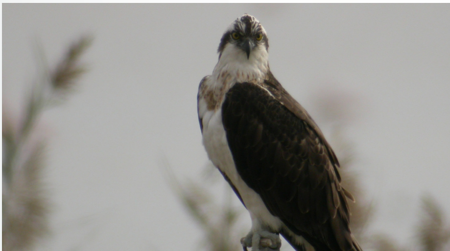
Águila pescadora ( Haliaeetus haliaetus ).