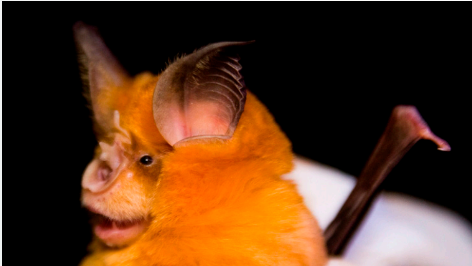
Murciélago mediano herradura ( Rhinolophus mehelyi ). Autor: José Manuel Méndez