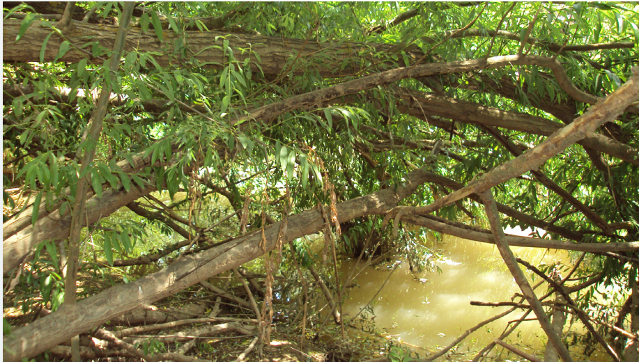
Río Guadalimar, entre los arroyos de San Ambrosio y Lupión. Autores: D. Cabello y otros