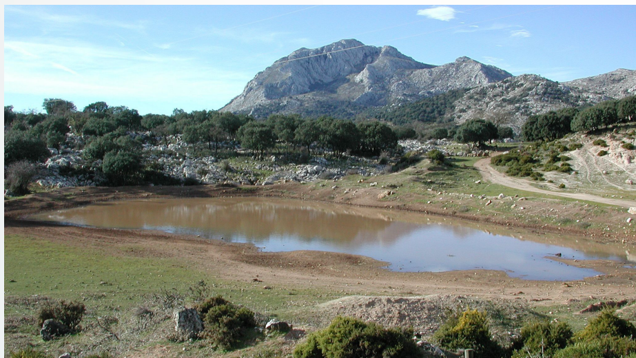
Matorral mediterráneo y pastizal en la Sierra de Camarolos