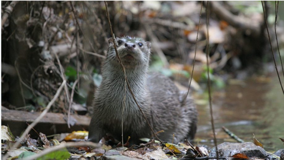
Nutria ( Lutra lutra).