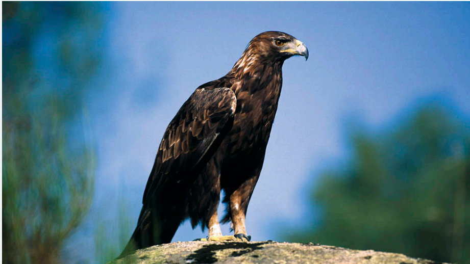
Aguila Real ( Aquila chrysaetos )