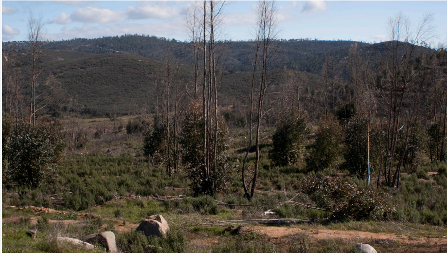
Eucaliptos junto a Rivera de Cala. Autor: Manuel Moreno García (BIOGEOS)