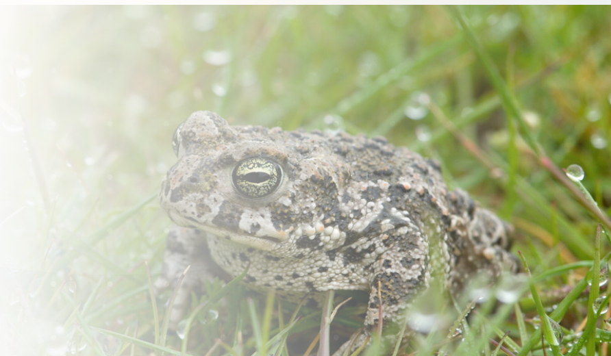
Sapo Corredor (Bufo calamita). Autor: Héctor Garrido (Estación Biológica de Doñana-CSIC)