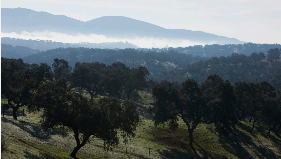
Paisaje de dehesa. Autor: Enrique Touriño Marcén