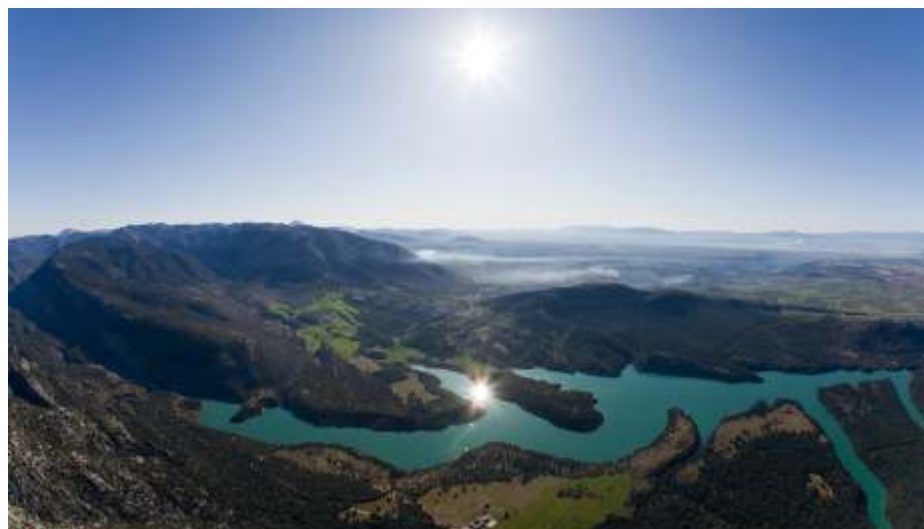
Vuelo sobre las Sierras . Autor: Javier Hernández Gallardo