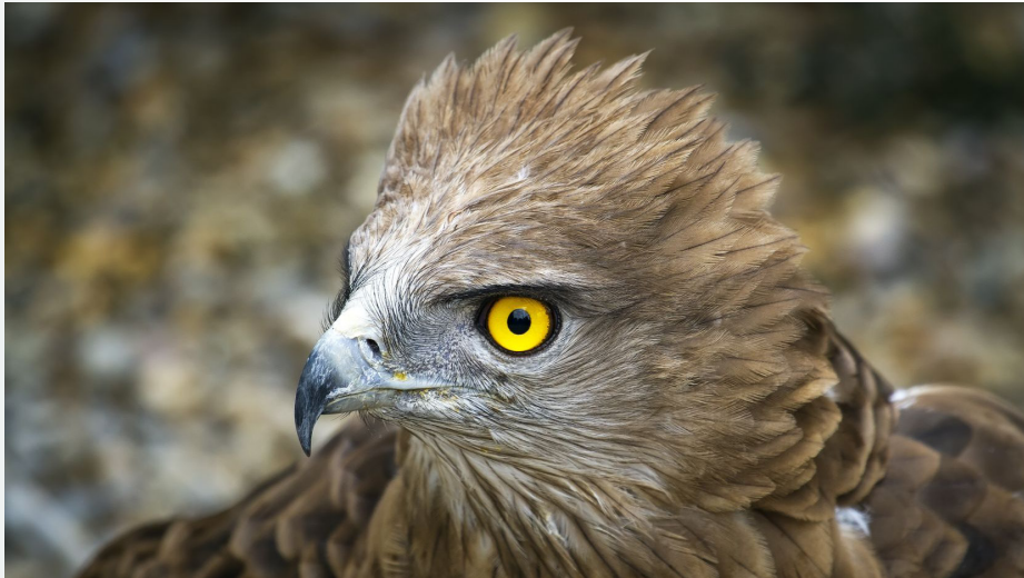
Águila culebrera ( Circaetus gallicus).