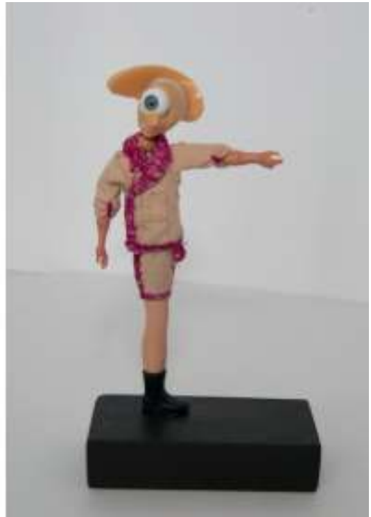
"Mundo Muñeco", técnica mixta

En el trabajo de Arsenio Rodríguez, las claves que generan un discurso tan personal como perturbador se encuentran en la interrelación del uso de materiales reciclados con el planteamiento de problemáticas vigentes y diversas como la sostenibilidad, la reivindicación de lo artesanal, lo metamórfico o la identidad híbrida. Un corpus artístico relacionado directamente con lo físico y su materialidad.