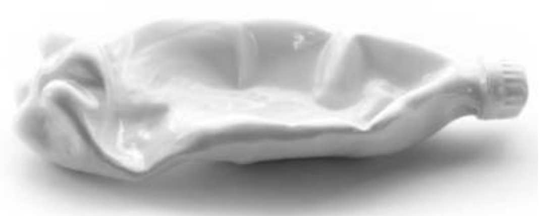
"Línea basura", envases reciclados modelados en arcilla esmaltada