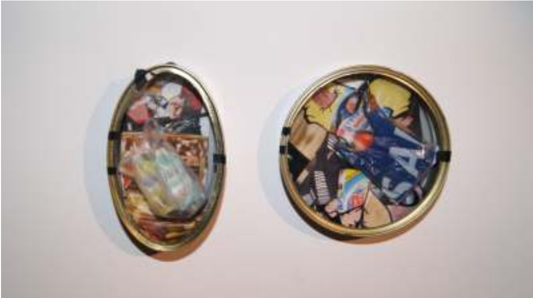
"Reciclarios", óvalo: 10'5 x 6'6 x 2'8 cm. círculo. 10 x 10 x 2'5 cm. Recortes de papel pegados al fondo de latas de conserva metálicas con tapa de acetato y cinta aislante. En su interior, ensamblaje de plástico con gancho metálico para pendientes.