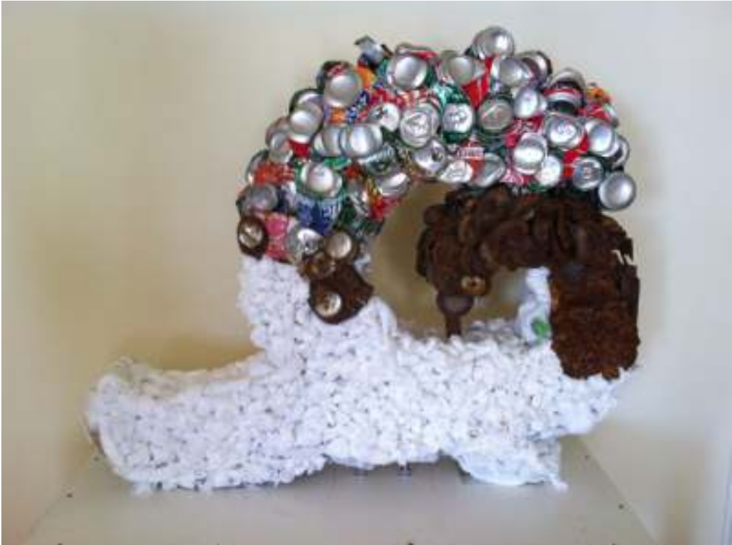
"Sin título", 90 x 90 x 11 cm. Escultura realizada con distintos materiales de desecho recogidos en la playa

Plantear de forma crítica la problemática del desecho de residuos en espacios naturales.