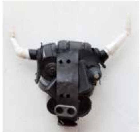
Izq. "Volcán", técnica mixta