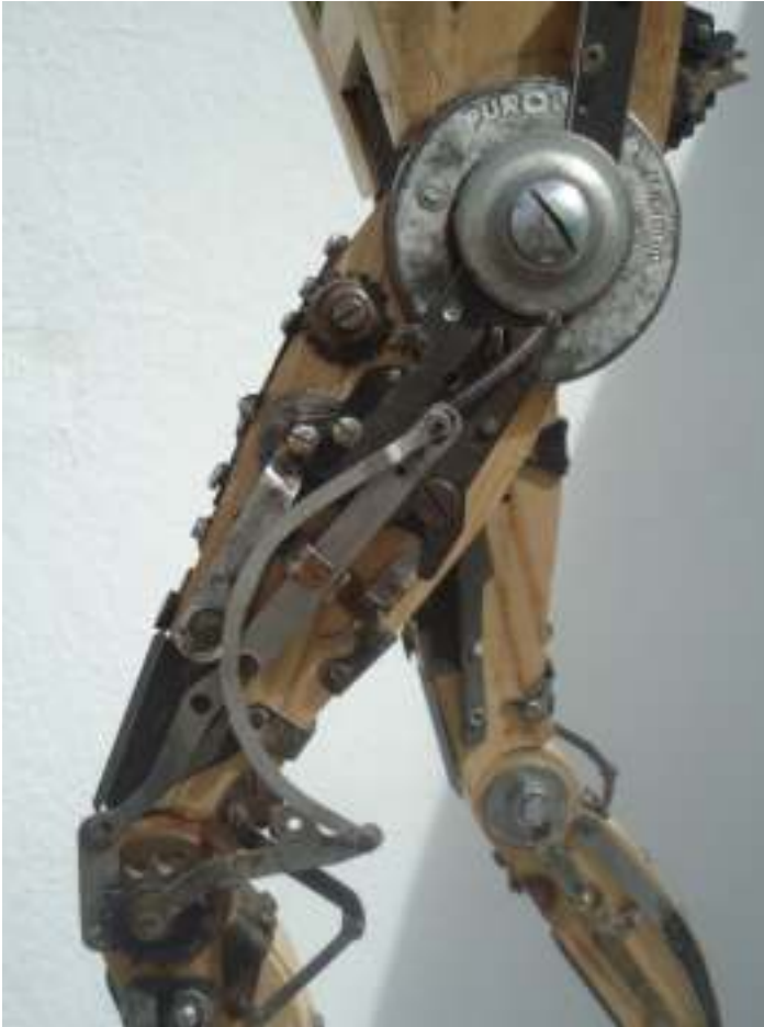
"El recolector de luces", 2013, 85 x 23 x 30 cm, materiales reciclados encontrados en la calle