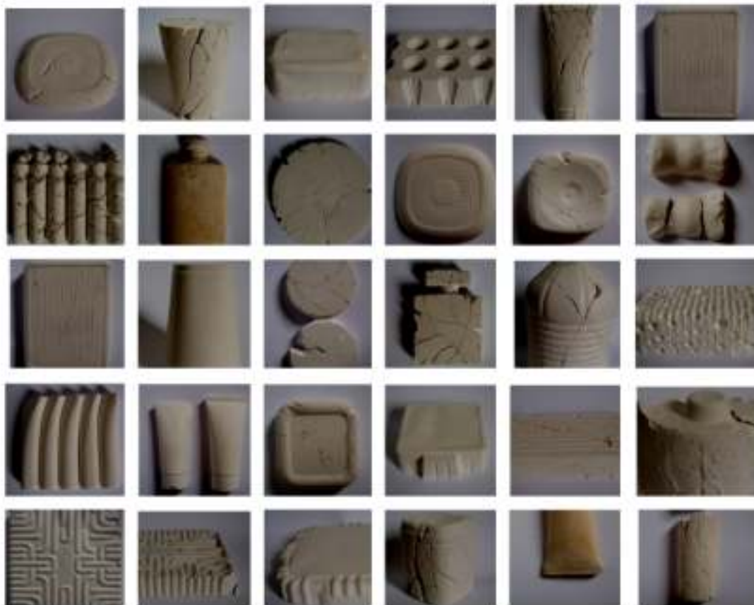
"Conservación y muestra", 190 x 40 x 10 cm la balda. Objetos desde 5 x 10 x 10 cm hasta 20 x 30 x 10 cm. vaciados en escayola intervenidos sobre balda de madera.

En esta pieza se aborda el proceso último del método arqueológico, inspirada en la conservación y preservación de los museos de historia.