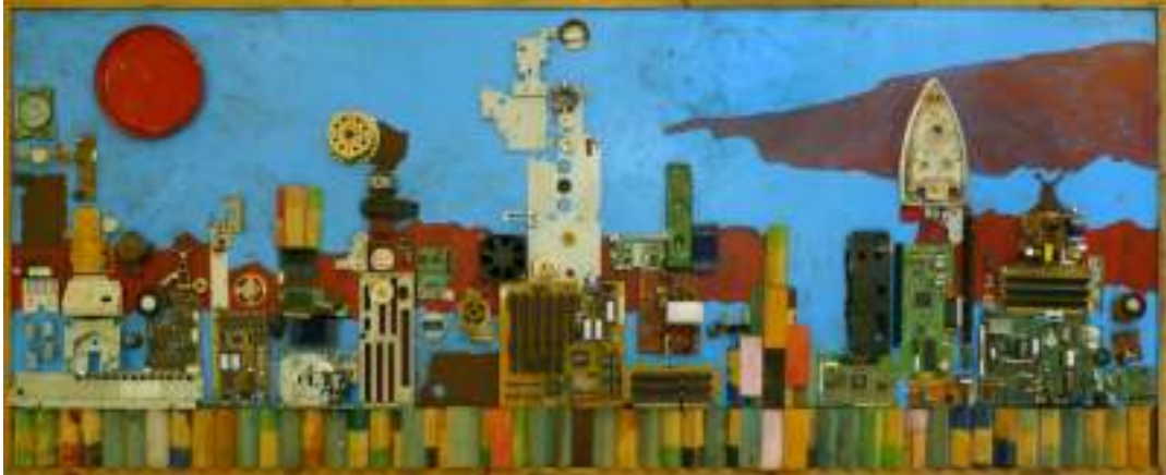
"Ciudad flotante", 1.90 x 90 cm, técnica mixta, elaborado con distintos materiales reciclados: pequeños electrodomésticos, ordenadores, circuitos...

Decidimos hacer algo. Hicimos una ciudad. "Una ciudad que flotara"