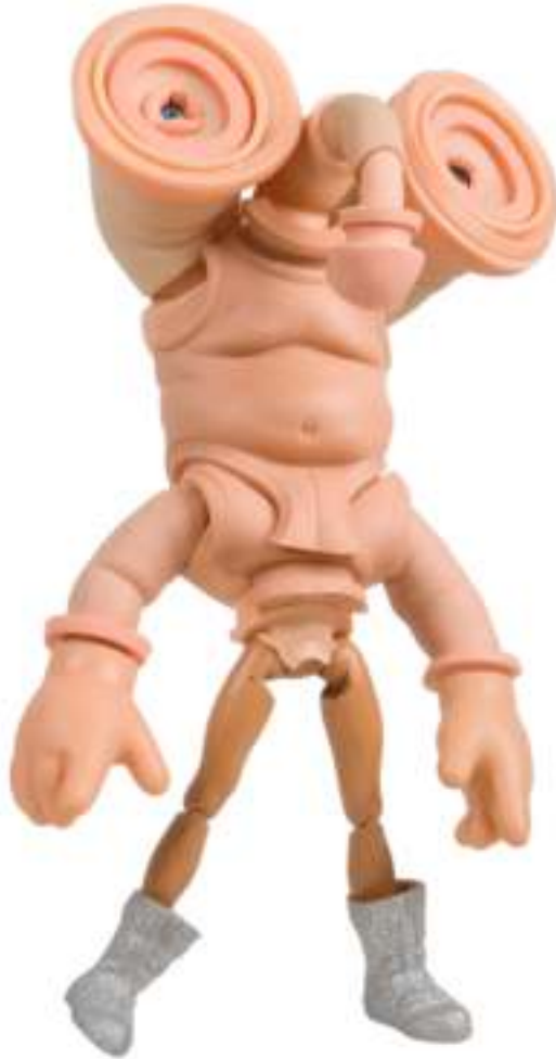
"Mundo Muñeco", técnica mixta

"Construir es la manera más poderosa de resolver problemas, expresar ideas y enmarcar nuestro mundo"