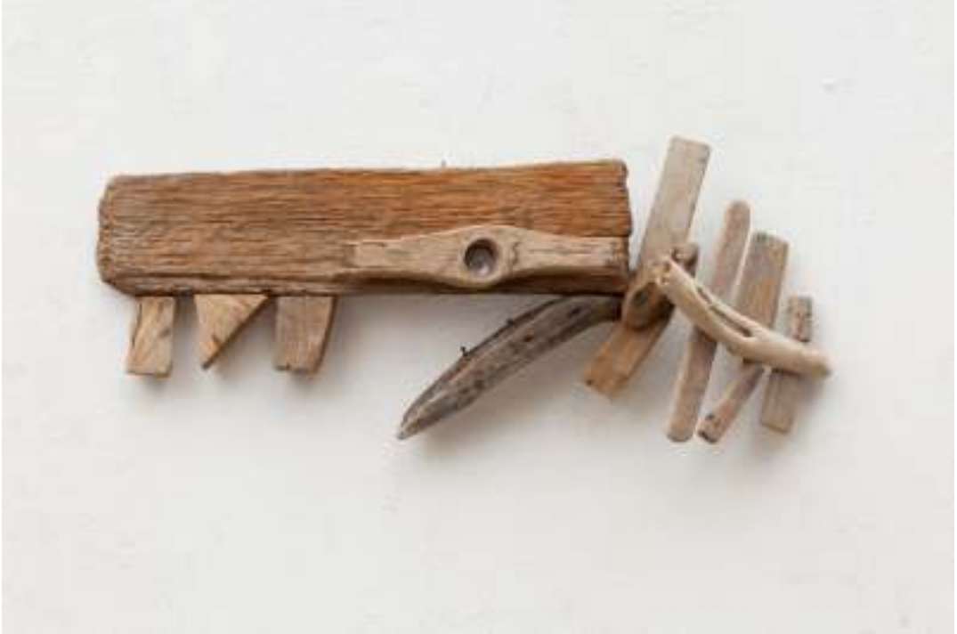
"Fósil", 2012, técnica mixta

"...Si al pasear veo piezas que me sonríen desde el suelo, no puedo hacer otra cosa que recogerlas para observarlas más de cerca.