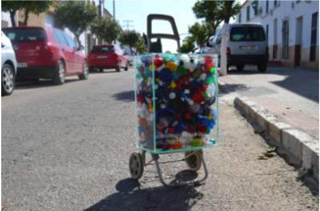
"Destape", 2013, : 95 x 40 x 32 cm, peso aproximado: 16.5 kg Aluminio, cristal y plástico