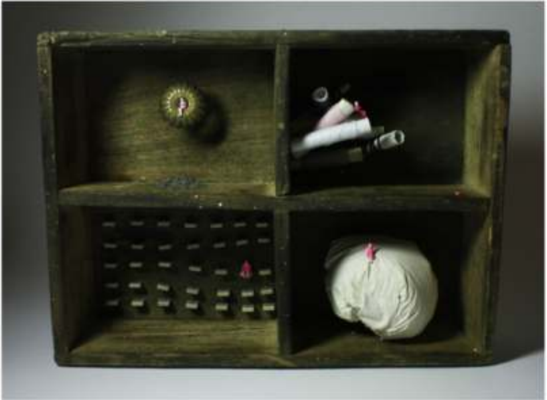
"Amables pérdidas de tiempo", caja de madera, individuos para maqueta pintados, pieza de ornamentación metálica, ovillos de hilo, mini azulejos cerámicos esmaltados y escayola fraguada en bolsa (todo recuperado del olvido)