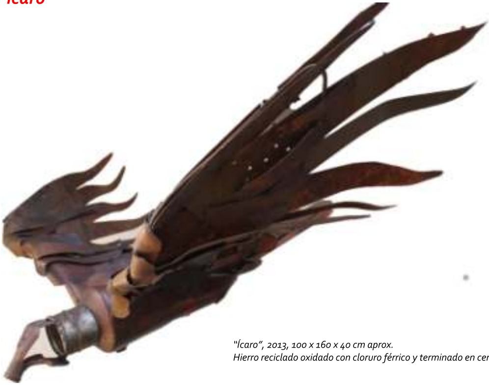
"Ícaro", 2013, 100 x 160 x 40 cm aprox. Hierro reciclado oxidado con cloruro férrico y terminado en cera.

El impacto que causan los desechos que producimos afectan gravemente al ambiente, a las plantas, al balance de los ecosistemas, y aún más directamente a los animales.