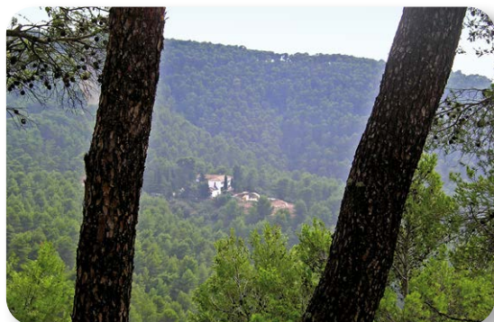
Desde el sendero, en los claros que el bosque deja, podremos ver el aula de la naturaleza Las Contadoras, inmersa también en el pinar.

El sendero nos conducirá en poco más dos kilómetros a uno de los mejores miradores naturales de todo el parque. Pasaremos la entrada del aula de la naturaleza Las Contadoras [2], dejando su carril de acceso a nuestra izquierda.