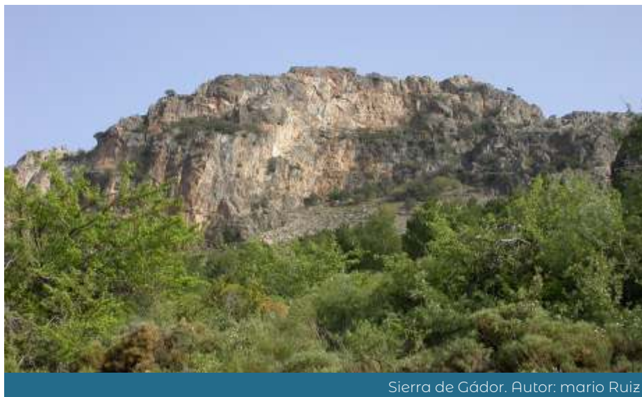
Sierra de Gádor. Autor: mario Ruiz