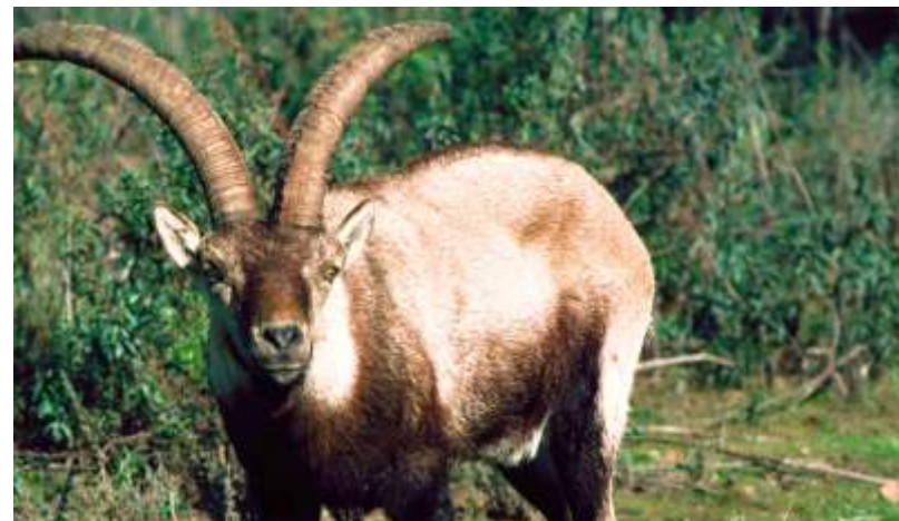
Cabra montés ( Capra pyrenaica )