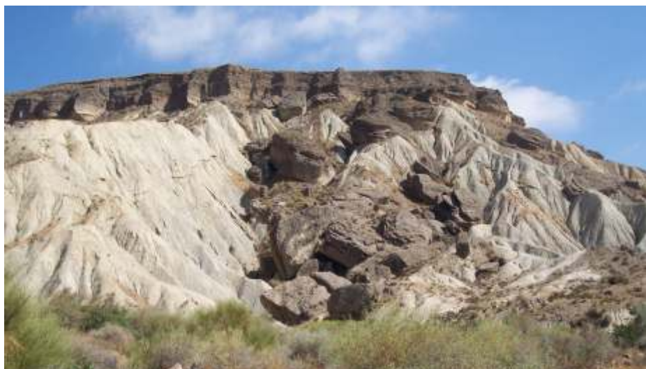
Afloramiento margoso en la rambla de San Indalecio.