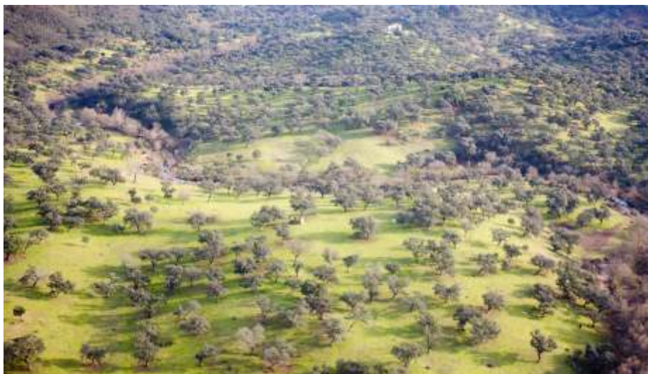
Vuelo sobre Sierra Pelada. Autor: Javier Hernández Gallardo