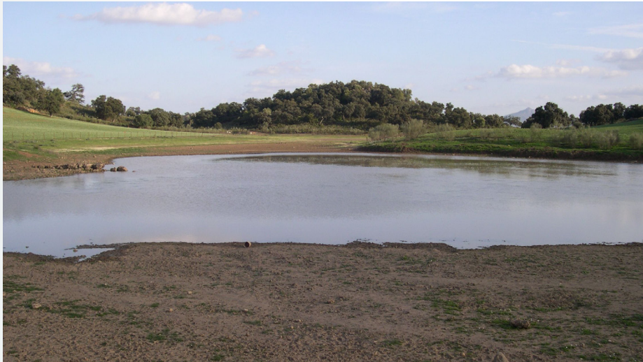
Laguna de Coripe