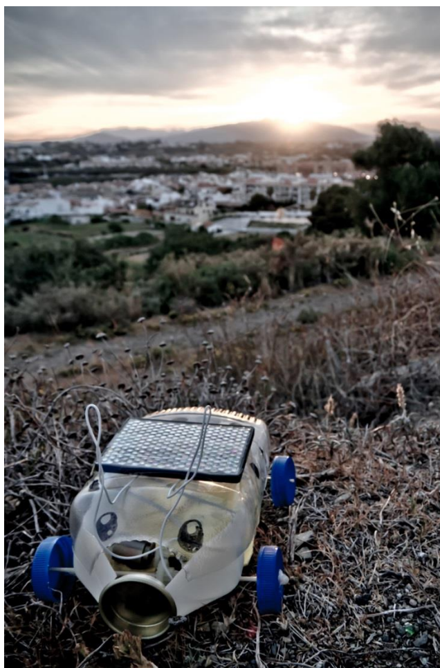
“Renovable y reciclable”, de José Moreno Martín. Finalista XXIX Concurso Fotográfico Día del Medio Ambiente.