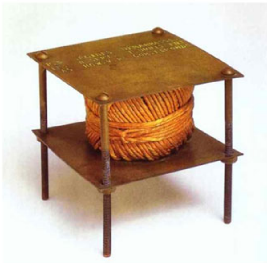
"Un ruido secreto", Marcel Duchamp, 1916