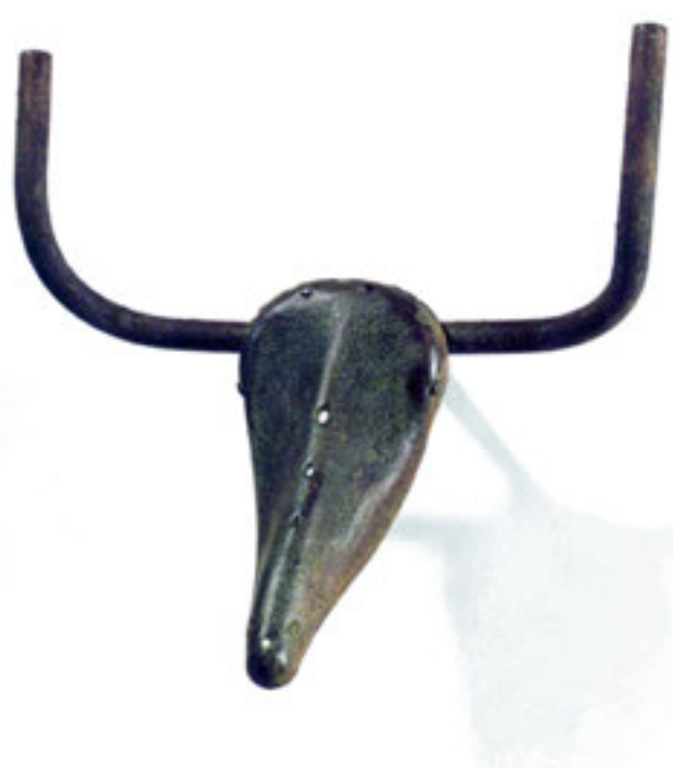
"Cabeza de toro", Pablo Picasso, 1942