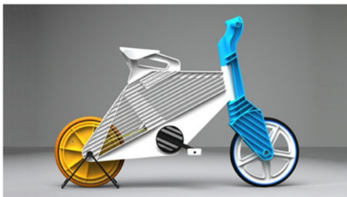
"Future Bike Recycled Plastic", Drod Pelleg, 2011