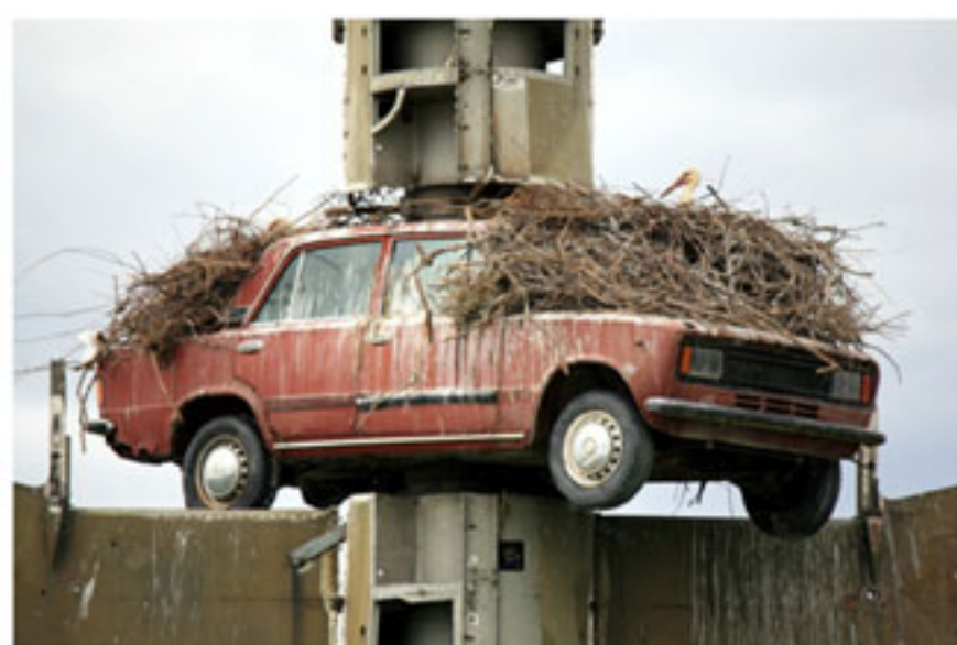
"¿Por qué el juicio entre Jesús y Pilatos duró sólo dos minutos?", Wolf Vostell, 1986