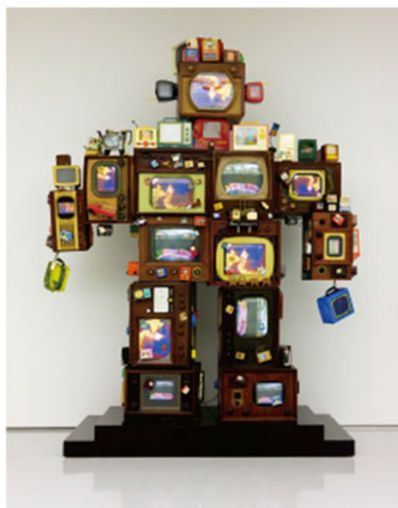
"TV is kitsch", Nam June Paik, 1996