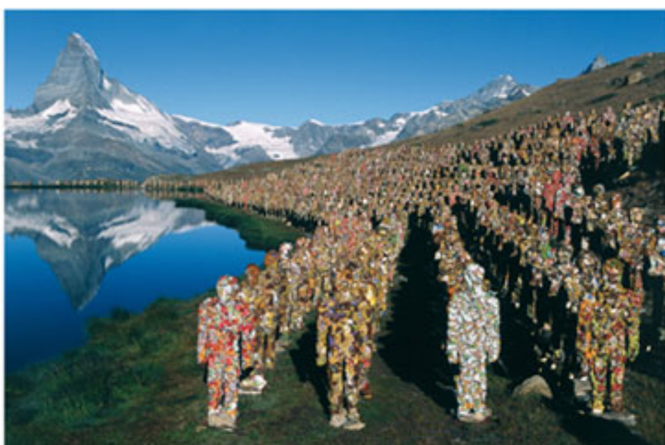
"Trash People", H.A. Schultz, 2003