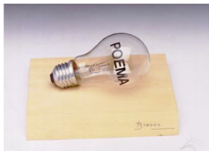
"Bombilla, poema-objeto", Joan Brossa, 1967