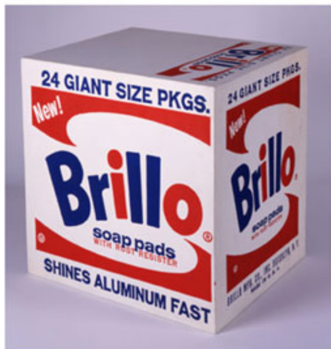
"Brillo Box", Andy Warhol, 1964