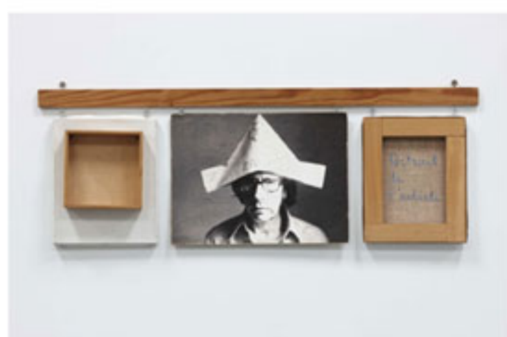
"Autorretrato bien hecho, mal hecho, no hecho", Robert Filliou, 1973