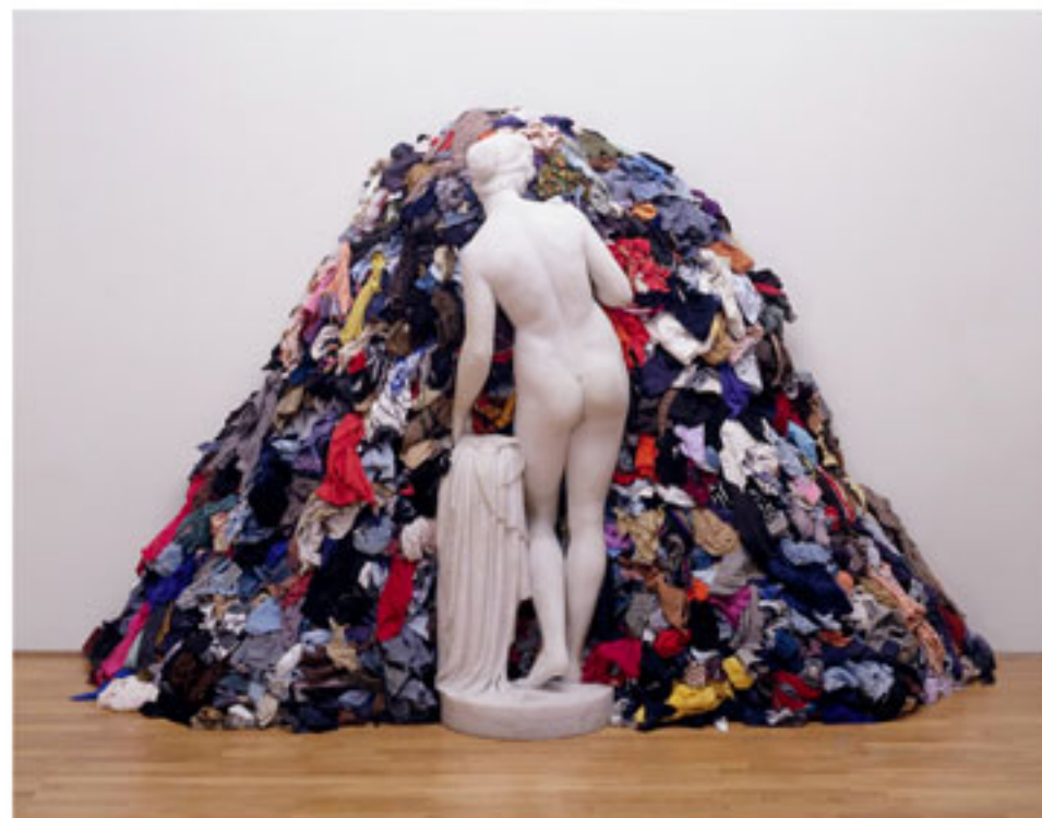
“Venus of the rag”, Michelangelo Pistoletto, 1969

El arte povera es un claro exponente del reciclado de materiales sin significación cultural alguna, materiales de los que no importa su procedencia ni su uso, reciclados o transformados por el artista en una indagación estética sobre las relaciones entre el material, la obra y su proceso de fabricación en un claro rechazo ante la creciente industrialización, metalización y mecanización del mundo que les rodeaba, incluido el del arte.