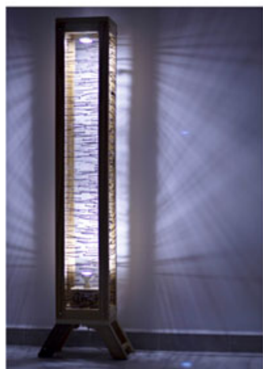
"Epal, lámpara de pie", Apaletarte, 2014 (pieza seleccionada Reciclar Arte 2014)

(Arriba) "Línea basura", Cuca Santurino, 2011 (pieza seleccionada Reciclar Arte 2013)