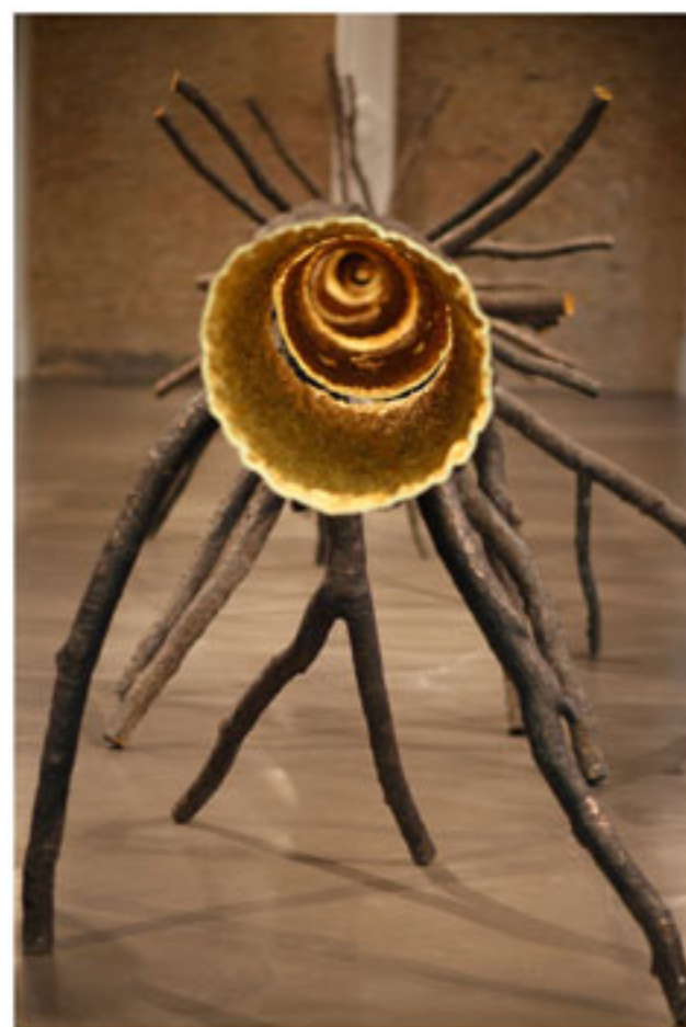
“The Bloomberg Commission”, Giuseppe Penone, 2000