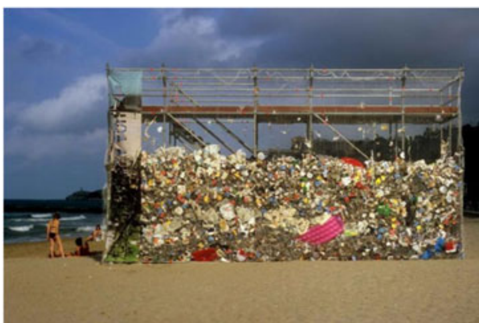
"Eres lo que tiras", Basurama, 2007