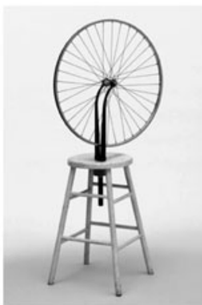
"Rueda de bicicleta", Marcel Duchamp, 1913