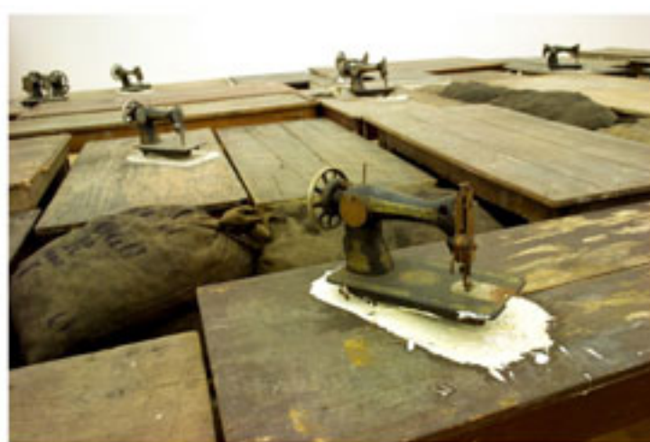
“Lavoro di genazzano”, Jannis Kounellis, 2000