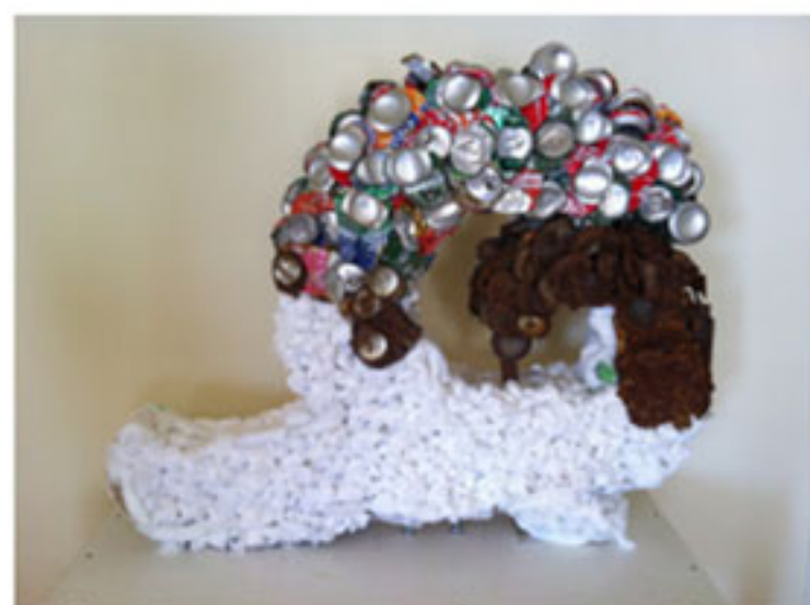
"S/T", Guillermo Ronda, 2013 (pieza seleccionada, Reciclar Arte 2013)