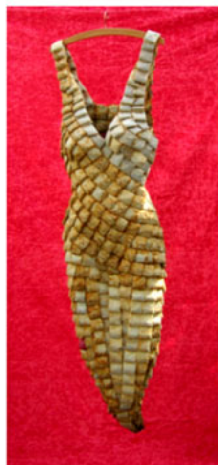
"Explorando-té", Pedro Gómez Pastrana, 2013 (2º Premio Reciclar Arte 2013)