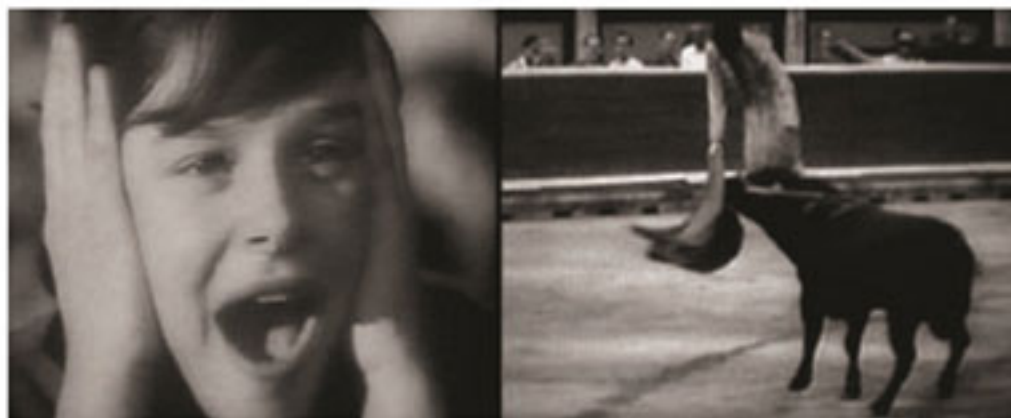
"The Toro's Revenge", María Cañas, 2005