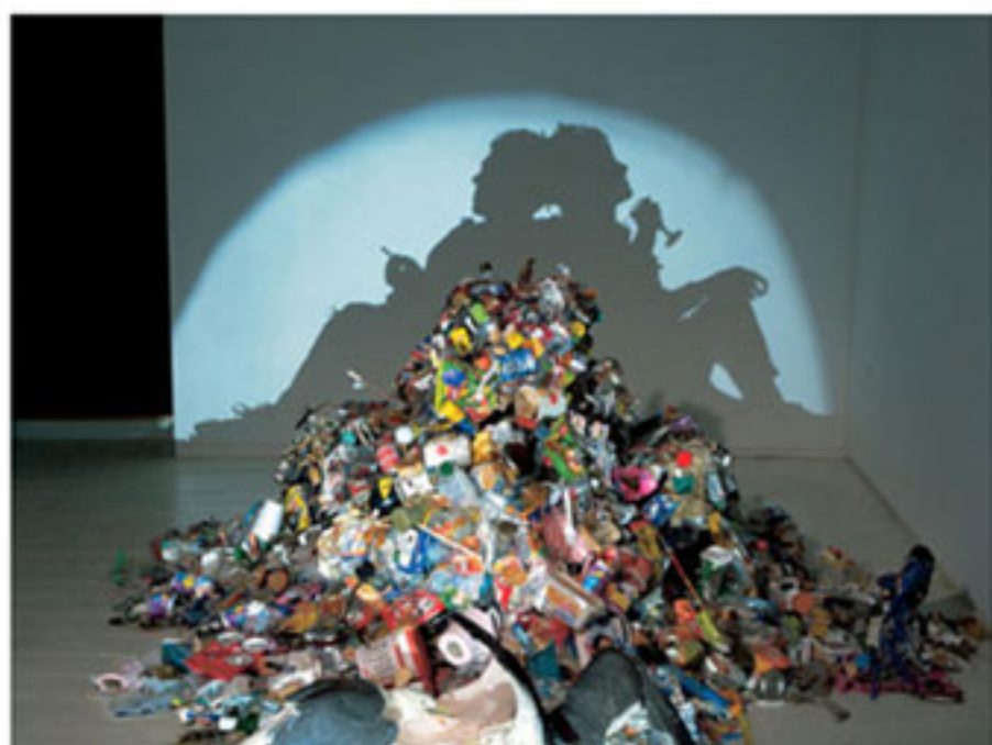
"Real life the rubbish", Tim Noble y Sue Webster, 2002