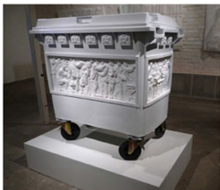
"Friso", Recycle Group, 2012