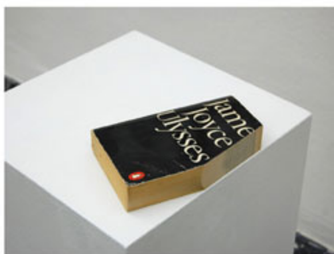
"The Joycean Society", Dora García, video-instalación, 2012