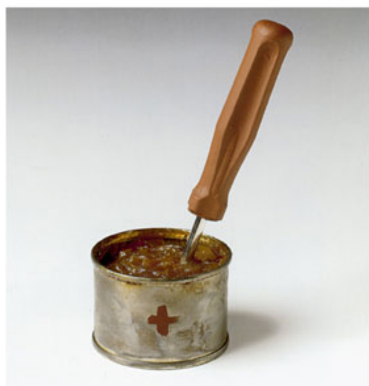
"Object to smear and turn", Joseph Beuys, 1972