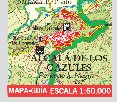
MAPA-GUÍA ESCALA 1:60.000