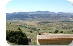
Con la sabina mora, la más frecuente en Andalucía, son tres las especies de sabinas representadas en el sendero

Desde aquí tenemos una amplia vista del llamado corredor de Chirivel. A la derecha vemos el Morrón de Los Pavos y, a la izquierda, el Peñón del Mediodía. Descansemos en los bancos habilitados al efecto y contemplemos el gran espacio ante nosotros, diferenciando la Sierra del Saliente, la Sierra de Las Estancias y la Sierra de Filabres, con la Tetica de Bacaes a la derecha.