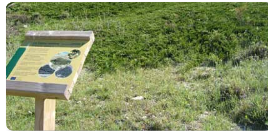
Espléndido ejemplar de sabina rastrera

El sendero no es ahora tan escarpado y el bosque mixto está más despejado, aunque se observa como la regeneración natural va poco a poco instalándose en antiguos terrenos de cultivo marginal. Hay una pequeña surgencia de agua no encauzada junto al camino. Desde aquí vemos el contraste de vegetación existente entre las dos laderas que forman el barranco.