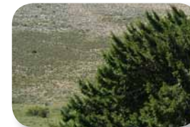
Sabina albar. Reliquia de los bosques esteparios del Terciario

Realizamos una pequeña bajada desde el carril que nos sirve de sendero para llegar a la zona en la que se encuentra el Monumento Natural Sabina Albar [3]. Junto al camino se ha construido una pequeña área de descanso con unos bancos y una fuente. También se ha adecuado un pequeño sendero para bajar a donde se encuentra el ejemplar de sabina de más de 600 años de edad. Todas las palabras sobran, os recomendamos que entréis debajo de ella y observéis su retorcido tronco. Tenemos una pequeña mesa informativa sobre la especie de sabina albar y otra más grande sobre el hecho de ser un Monumento Natural.