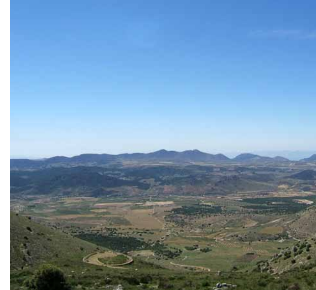
Paso natural del hombre desde la prehistoria.