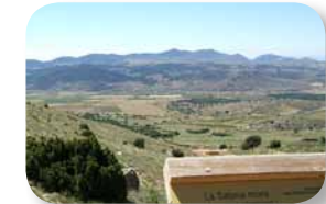
Con la sabina mora, la más frecuente en Andalucía, son tres las especies de sabinas representadas en el sendero

Desde aquí tenemos una amplia vista del llamado corredor de Chirivel. A la derecha vemos el Morrón de Los Pavos y, a la izquierda, el Peñón del Mediodía. Descansemos en los bancos habilitados al efecto y contemplemos el gran espacio ante nosotros, diferenciando la Sierra del Saliente, la Sierra de Las Estancias y la Sierra de Filabres, con la Tetica de Bacaes a la derecha.