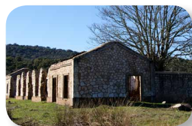
Esta construcción era el antiguo taller de las locomotoras. Detrás, podemos ver una gran elevación: son escombreras de la mina

El principio (ver [1] en el mapa) y al final de este sendero discurren por el antiguo trazado del ferrocarril que llevaba el mineral de la mina del Cerro del Hierro hasta el puerto de Sevilla, donde se embarcaba para llevarlo a Escocia. Junto a este trazado, hoy recuperado para su uso turístico y deportivo como Vía Verde, se conservan restos de las antiguas construcciones de la mina y del ferrocarril: almacenes, talleres, cargaderos, puentes y el poblado mismo del Cerro del Hierro, donde vivían las familias de los trabajadores de la mina.