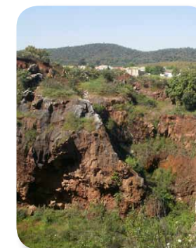
El poblado del Cerro del Hierro se construyó a las afueras de la mina para alojar a las familias de los mineros. Al avanzar la mina, siguiendo los filones, la mina llegó hasta el poblado, e incluso se demolieron casas para extraer el mineral sobre el que se asentaban

Avanzando en nuestro camino y ya cerca del poblado del Cerro del Hierro, entramos en un paisaje distinto [5]. El bosque adehesado da paso a un terrero con afloramientos de roca caliza, escombros y suelo erosionado. Estamos muy cerca de la antigua mina, donde la actividad extractiva ha descubierto y modelado un paisaje espectacular que ha merecido ser catalogado como Monumento Natural.