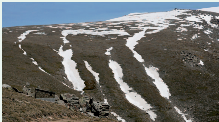
Refugio Peña Partida (TCD)

La ruta desde Güéjar Sierra hasta el Refugio de Peña Partida , es tan dura como hermosa. Se combinan en su recorrido la parte urbana del municipio, la zona de vega, los ríos, los bosques de robles y encinas, los cultivos de cerezo y la alta montaña de Sierra Nevada .