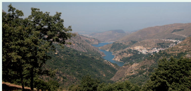
Vistas embalse de Canales y Güéjar Sierra (TCD)

El trayecto es muy exigente, pero el paisaje que se disfruta al final aumenta la emoción que genera culminarlo. Si observamos las cumbres, de izquierda a derecha, vemos el Picón de Jérez (3.090 m) y las caras norte de la Alcazaba (3.371 m) y Mulhacén (3.479 m). Por último, al oeste, destaca el perfil del Pico del Veleta (3.394 m) culminando el Valle del Guarnón, de origen glaciar.