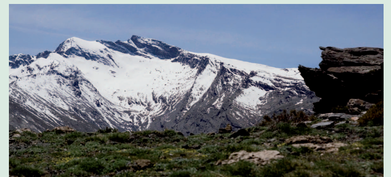
Veleta desde Loma Papeles (TCD)

Se puede iniciar en el centro del núcleo urbano de Güéjar Sierra. Después se internará en los terrenos aterrazados de los cultivos de la ladera de La Solana . La vegetación es pequeña y escasean los árboles hasta llegar al cauce del Río Maitena . Después, todo cambia. A ambos lados del trazado aparece una vegetación abundante en la que dominan los cultivos de cerezos, los encinares y robledales. Cruzamos la Acequia del Tío Papeles , una de las numerosas acequias de riego que recorren las laderas de Sierra Nevada. Una vez arriba, empieza el dominio de la nieve y el hielo que pueden condicionar el tránsito en invierno. Si es transitable, le rodeará un paisaje impresionante tanto en invierno como en verano. A medida que avanza la ruta, se va intuyendo lo que al final se convierte en realidad. Una panorámica clásica pero siempre impresionante de la altas cumbres; el corazón del Parque Nacional de Sierra Nevada .