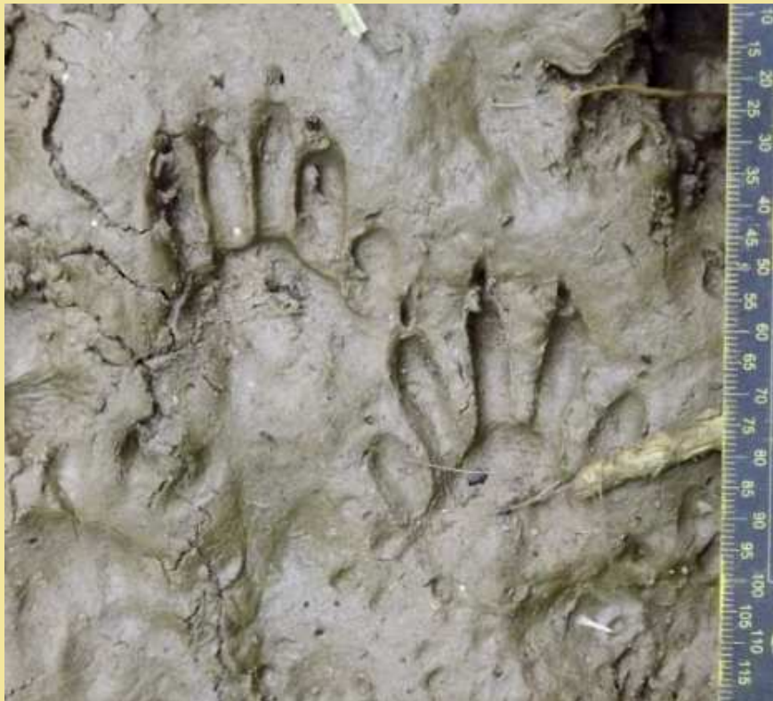
Huella trasera (arriba-izquierda) y delantera (abajo-derecha)

Sin embargo, las huellas de mapache son fáciles de identificar en un primer momento, y prácticamente inconfundibles con cualquier otra especie. Se caracterizan por la presencia de 5 dedos alargados tanto en manos como pies, asemejándose en cierto modo a unas “huellas humanas”. A pesar de tener uñas, no siempre son distinguibles en todos los sustratos.