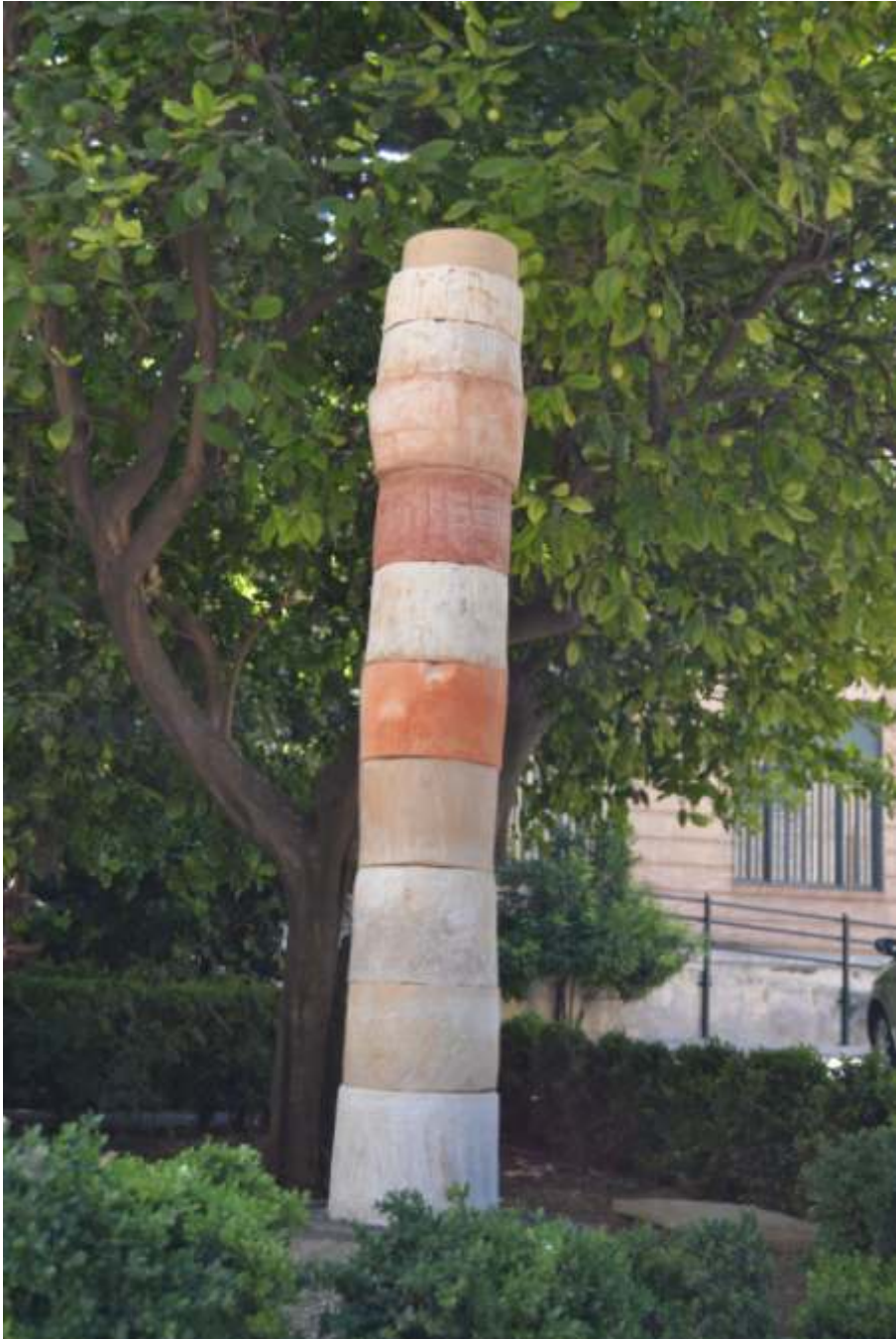
"etapas de la vida", 2011-2012, pieza constituida por 10 módulos de jabón de 35 x 21 cm. (aprox.) la escultura tiene unas medidas totales de 35 x 190 cm. materiales: jabón artesanal a base de aceites reciclados con aditivos naturales basada en los procesos de saponificación (reacción que produce la formación de jabones). la base de la escultura es de madera.