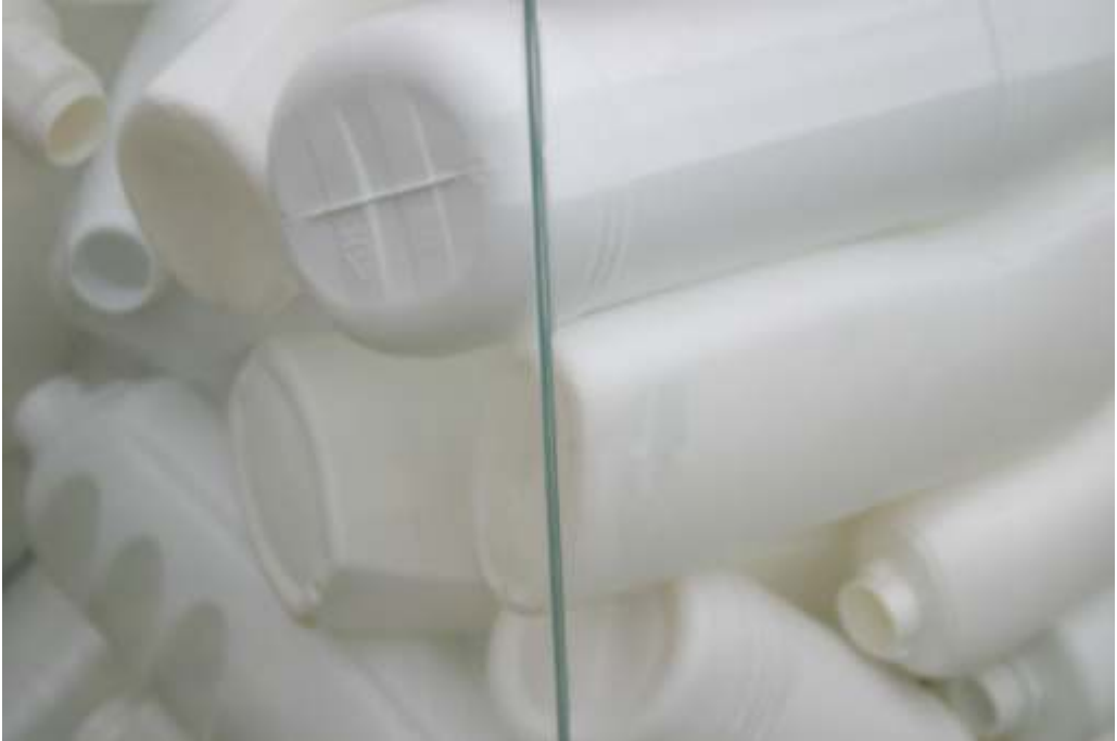
"bote limpio, bote blanco", 75 x 55 x 55 cm. materiales: cristal y plástico (detalle)

Bote limpio, Bote blanco es una metáfora que reivindica el poder de la acción ciudadana como base del cambio social. Un bote, un voto, es algo más que libertad, es un valor teñido de blanco, una diana que señala un horizonte al que caminar, un blanco que no es transparente, que es un blanco sólido, es sólo blanco, un color que se rebela ante toda la oscuridad que se cierne sobre nuestras cabezas. Hay blanco, hay esperanza.