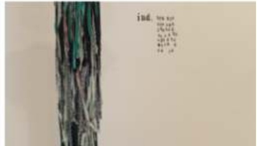
"ind. 709 536.....", 2014, materiales: pasamontañas, retales de diversas telas y puntillas, esparto tintado, papel de libro y plumas, relleno de pantalones vaqueros. letras y números estampados. dimensiones aproximadas: 160 cm.

Se trata de una ilustración tridimensional, un individuo creado a partir del ensamblaje de objetos en desuso. Esta pieza es parte de un archivo que comienzo hace poco para un proyecto que consiste en la observación de una sociedad ficticia, una sociedad ecléctica que se nutre de los resquicios de lo contemporáneo. Hasta el momento sólo he podido recuperar una serie de objetos rutinarios, otras piezas fúnebres y algunos apuntes sobre vestimentas y costumbres.