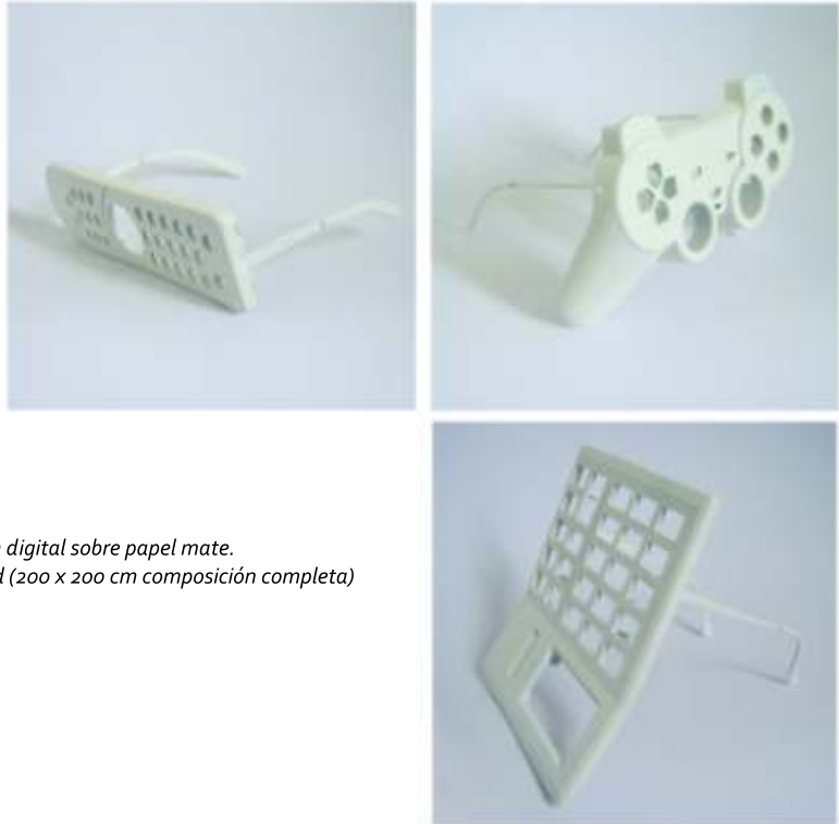
"tres tamices" impresión digital sobre papel mate. 100 x 100 cm cada unidad (200 x 200 cm composición completa)

El tamiz es una pieza fundamental dentro del equipo de trabajo de una excavación arqueológica. Tras la excavación y la toma de muestras, el inicio del estudio arqueológico para prehistoriadores es la criba, separación y tamizado de la tierra o roca hallados en busca de piezas más pequeñas, diferenciando entre restos útiles para estudio y no. Para esta pieza (fotografía, documentación del objeto) construí a partir de objetos electrónicos de desecho encontrados en la basura (un mando de TV, una calculadora y el pad de una consola de videojuegos) y gafas viejas, unas "lentes inútiles" con las que cribar lo que vemos a partir de objetos que se desechan y que por su utilidad nos remiten a tres grandes puntos de influencia que nos rodean (medios de comunicación, entretenimiento y economía) tamizando y cribando la manera de percibir todo lo que tenemos alrededor y la relevancia de lo tecnológico en la información que consumimos.