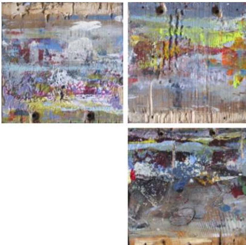
"paisajes encontrados", 2014. técnica mixta sobre tabla, serie de 10. las piezas oscilan los 10 x 10 x 2 cm.

La curiosidad hace que la mente encuentre y descubra elementos genuinos. Así pues, mientras realizaba un trabajo pictórico en una clase de pintura de la facultad, me sentí atraída por las composiciones cromáticas que se producen aleatoriamente en los agarraderos y bases de los caballetes que, como es normal, otros alumnos utilizan diariamente estos caballetes, sin prestar demasiada atención a las manchas que producen en los apoyos de los lienzos. Estas pequeñas piezas nos muestran una incontable superposición de horizontes cromáticos, que si dejamos que la imaginación nos hable podemos ver campos de lavanda, bosques lejanos, marinas o enormes tormentas, apuntes sobre vestimentas y costumbres.