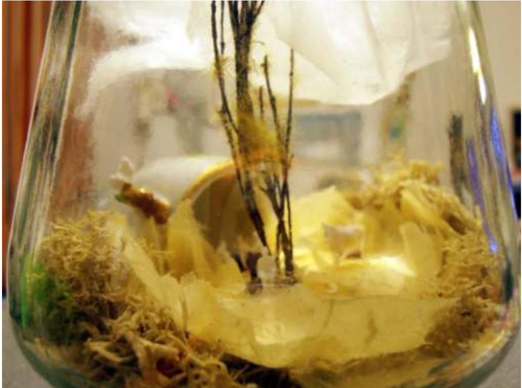
"mermelada bucólica" bote de mermelada de cristal, papel, ramitas, tacita de porcelana, figuritas de plástico y musgo, dimensiones: 8 x 10 cm.

La escena, se desarrolla en torno a una tacita decorada con una imagen rococó de amores pastoriles.