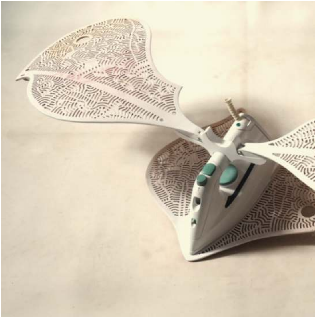
"electro.no domesticado" , 2014, 100cm; altura: 24,5 cm.; largo: 43,5 cm. materiales: materiales 95 % reciclados, una plancha usada, restos de una silla en madera de castaño, contrachapado de cajas de frutas, pintura blanca, barniz. las alas se pueden articular manualmente.