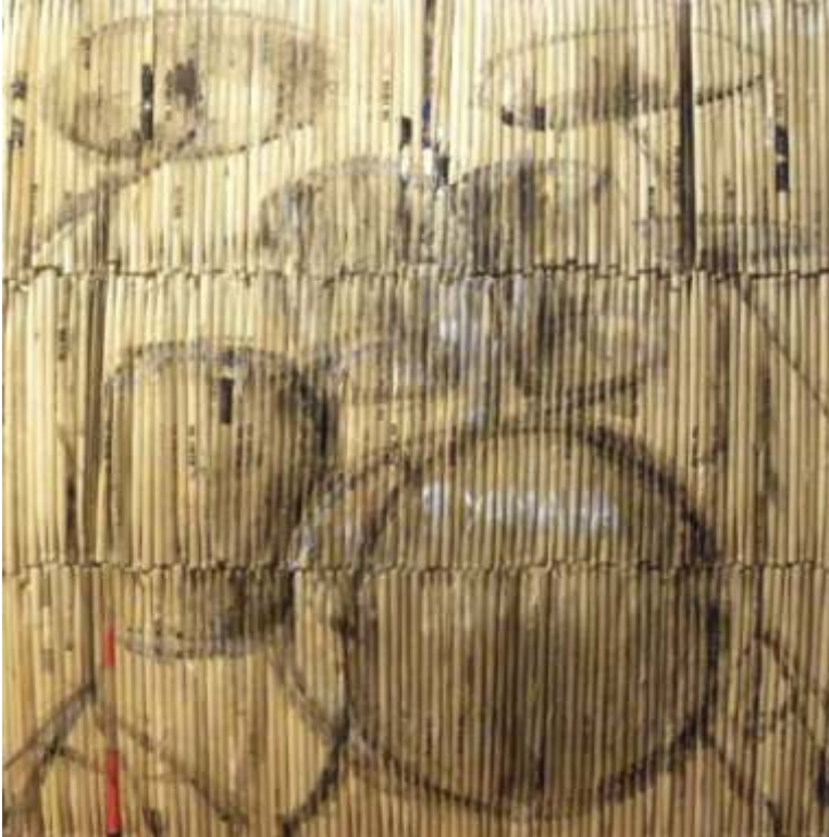
"el ritmo y el alma del artista", 125 x 123 cm. soporte: baquetas de madera. técnica: acrílico

Esta pieza consiste en tener como soporte baquetas de madera reutilizadas. La idea surge rodeándome de un ambiente de músicos donde ves que los bateristas rompen muchas baquetas en ensayos y conciertos, acabando en el cubo de basura teniendo cada una de ellas el ritmo de la nota tocada. Al ser de madera y sabiendo que el árbol es un icono muy importante en el medio ambiente, no podía dejar esas baquetas rotas con tanto proceso vivido. Durante cuatro años recopilé cientos de baquetas que en esta pieza representan sutilmente una batería con acrílico que al acercarte a la obra pierde dimensión. Muchas baquetas rotas, muchos conciertos y muchas maneras de reutilizar.