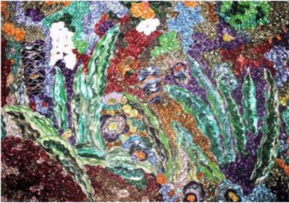
"mis lirios", 87 x 74 cm. composición realizada con cápsulas de café fijadas a una base mediante silicona caliente y marco reciclado del contenedor.

Desde el primer instante en que vi este envase (aluminio con multitud de colores brillantes), pensé que no podía depositarlo en un contenedor de basura. En mi mente aparecieron las obras de los impresionistas, como óptimas para realizar con este material, sabía que el proceso de limpieza sería muy largo, lento y bastante sucio, aún así comencé. Yo no tomo café así que estas cápsulas viajan desde diferentes provincias (Valencia, Madrid y Teruel) hasta mi casa, Personas cercanas y no tan cercanas a mí guardan las cápsulas para mis obras. En esta ocasión he tenido que aplicar color para algunos verdes, y para el blanco; normalmente los colores que mezclo son tal cual se venden en el mercado. La obra que presento está basada en "Los lirios" de Van Gogh.