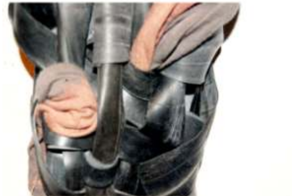
"tejiendo yoes" , 175 x 48 cm. barra de sujeción de 90 cm materiales: cámaras de bicicleta, ropa usada, barra de acero, hilo de algodón, trapillo técnica: trenzado, crochet, tramado y punto.