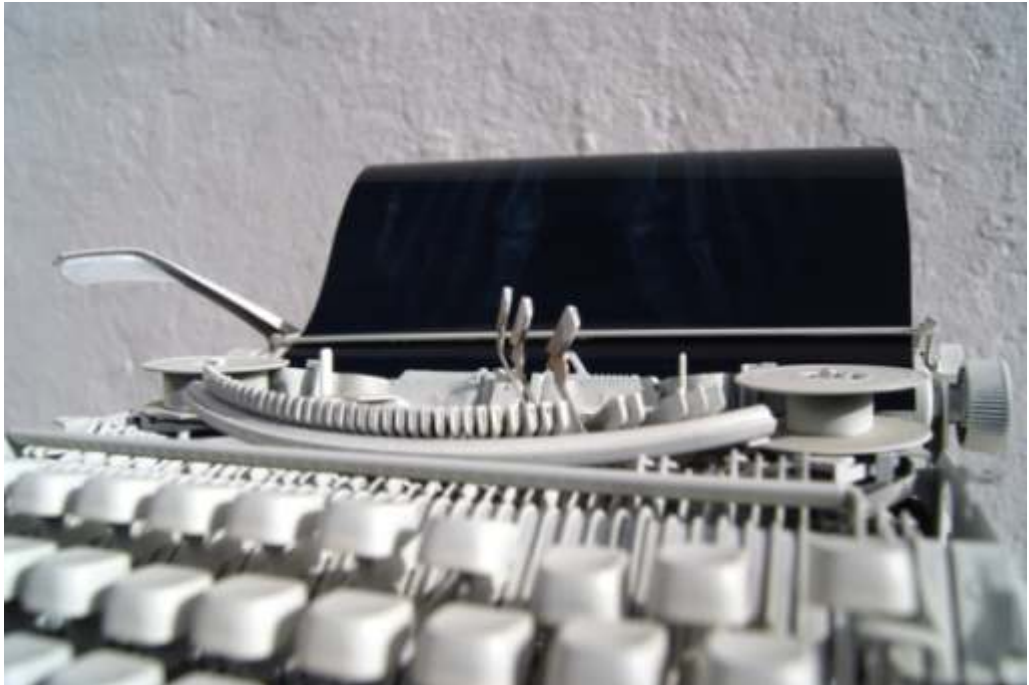
"tránsito", 50 x 50 x 50 cm. aprox. máquina de escribir recuperada de un contenedor de basura, pintada en blanco con spray de esmalte acrílico y radiografía

En la presente obra trato de conjugar varios conceptos a la vez y enlazarlos de modo explícito o visual a través de objetos encontrados y empleados o reutilizados. Por una parte el concepto de esqueleto como armazón sustentante, sustento de cualquier cuerpo u objeto sensible inherente a cualquier obra tridimensional y que en si misma se muestra como algo terminado que no admite o pretende más coraza, y que nos sirve de tránsito hacia otras direcciones advirtiéndonos de la posibilidad de reutilizar elementos desechados en varias direcciones, bien como paso intermedio cual sería propiamente el destino de los materiales a reciclar, bien como elemento definitivo como es el caso de la acción o hecho artístico presentado, manifestación de arte encontrado con la cual se otorga una nueva dimensión a elementos de desecho en similitud a la acción medioambiental de reciclar.