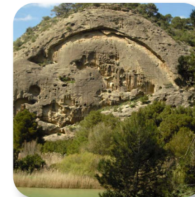
Arco dibujado sobre una enorme pared de arenisca, originado a partir del efecto erosivo de las fuertes rachas de viento sobre las baldas rocas de naturaleza arenosa

Es también característico de este paraje la composición de sus montañas por rocas areniscas, mucho más sensibles a la erosión producida en esta ocasión por el efecto de las fuertes rachas de viento. En este sentido podremos observar en la orilla contraria, un espectacular arco trazado en una pared de arenisca conocida como La Roseta.