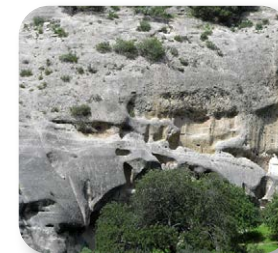
Las paredes de esta montaña están compuestas por areniscas que permiten la formación de cuevas, antaño aprovechadas como viviendas

Es también característico de este paraje la composición de sus montañas por rocas areniscas, mucho más sensibles a la erosión producida en esta ocasión por el efecto de las fuertes rachas de viento. En este sentido podremos observar en la orilla contraria, un espectacular arco trazado en una pared de arenisca conocida como La Roseta.