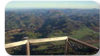
Una magnífica atalaya para disfrutar de las vistas

Se trata del Mirador de las Víboras [4], un saliente rocoso del terreno protegido con barandillas y con un banco de piedra donde disfrutar del entorno. Una vez retomada la marcha el sendero comienza a perder altura con mucha rapidez. Pasamos junto a una era [5], lugar