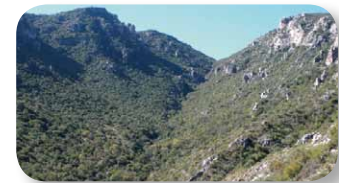
La garganta del Canalizo, espectacular barranco de frondosa vegetación

donde se trillaba el trigo para separar el grano de la espiga. Al poco tiempo el sendero cambia de orientación y aparece ante nosotros la espectacular garganta del Canalizo, de abundante vegetación. El sendero ahora baja casi paralelo al arroyo de dicho barranco hasta llegar a área recreativa de Los Nacimientos.