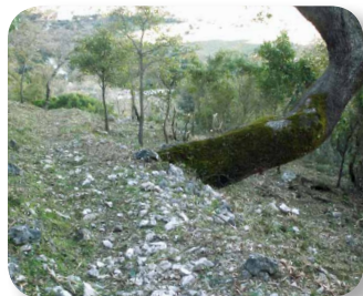
El quejigal se desarrolla sobre estas laderas umbrías

En Andalucía, el quejigo es frecuente en lugares montañosos y húmedos. Las bellotas maduran y se diseminan hacia septiembre u octubre, antes que las de la encina, y son muy apreciadas para la montanera (tiempo durante el cual los cerdos se alimentan de bellotas en el monte) ya que permiten prolongarla.