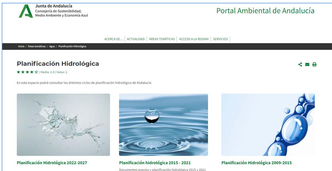
Figura nº 1. Página web de la Consejería de Sostenibilidad, Medio Ambiente y Economía Azul

Por otra parte, se habilitó una zona específica para el Plan Hidrológico de la Demarcación Hidrográfica Tinto, Odiel y Piedras en la Web de la Consejería ( https://www.juntadeandalucia.es/medioambiente/portal/home ), dentro del área de actividad “Agua” (Figura nº 1), donde se publica toda la información que se va generando en el proceso de planificación. En esta misma sección se integra la información generada relacionada con el Plan Especial de Sequía y el Plan de Gestión del Riesgo de Inundación (en adelante, PGRI).