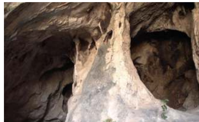
Acceso a la Cueva de Belda I.