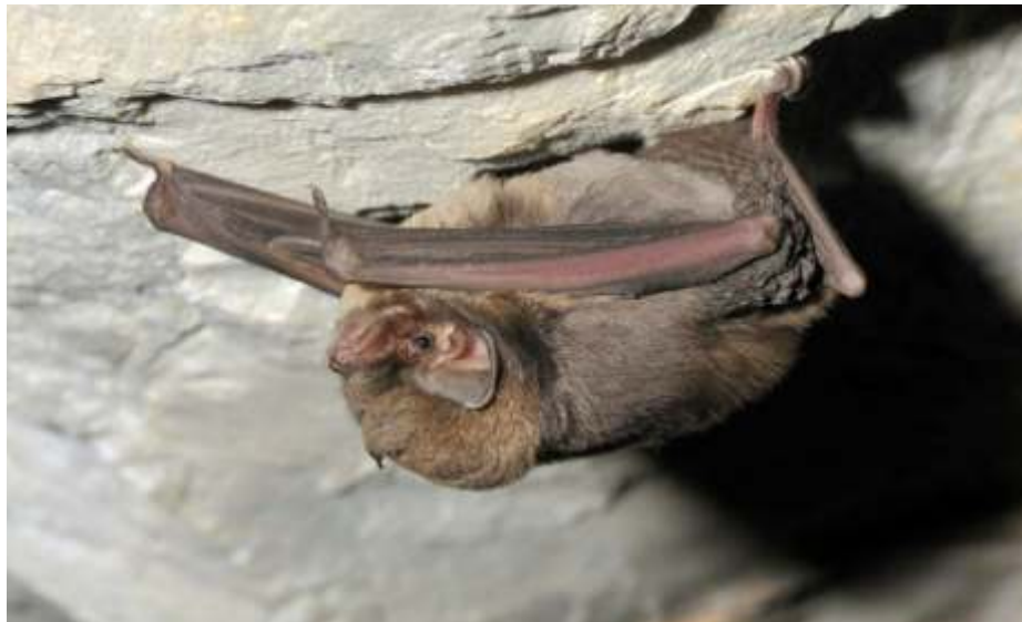
Murciélago de cueva ( Miniopterus schreibersii ).