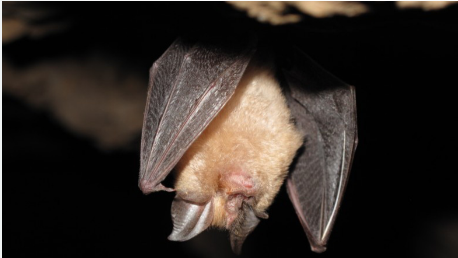
Murciélago grande de herradura ( R. ferrumequinum ). Autor: Diego García