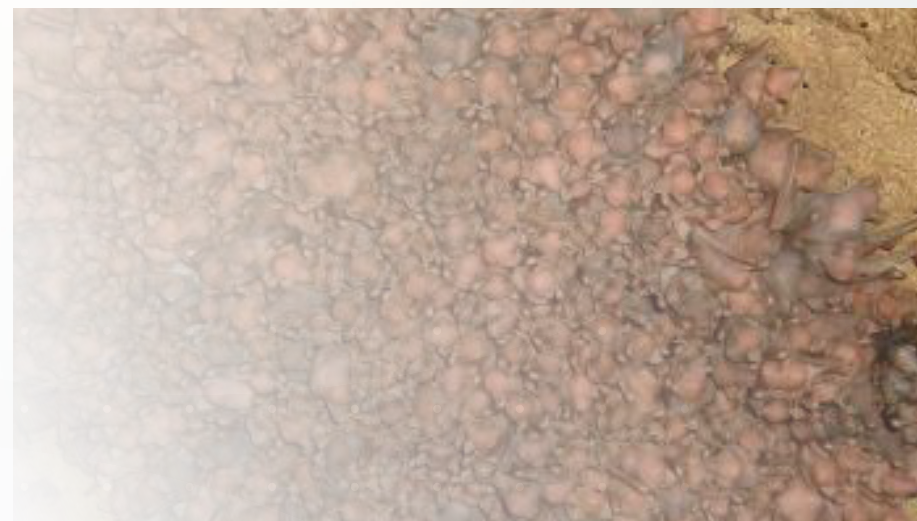
Colonia de Murciélago de cueva ( Miniopterus schreibersii )