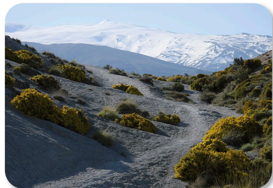
El paisaje arroja en estos parajes unos contrastes asombrosos

Desde aquí comenzaremos a ascender hacia a la denominada “cuerda del Trevenque”; nos hallamos ahora en un entorno árido, donde los arenales dolomíticos apenas si permiten la supervivencia de aulagas, plantas aromáticas y algún pino aislado junto a la presencia de endemismos altamente especializados. Los endemismos son especies exclusivas de determinadas regiones o zonas, de manera que su fragilidad es enorme, pues su desaparición del área geográfica donde se encuentran, supone la extinción total de dicha especie.