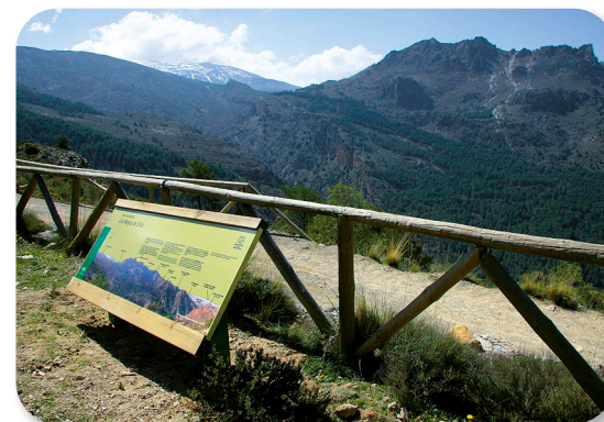
Panel interpretativo del paisaje junto al refugio de Rosales

Seguimos en zigzagueante descenso por la pista forestal que habrá de llevarnos al río Dílar, no sin antes pasar junto al enclave del