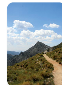
Ultimos tramos sendero y Boca de la Pescá

A partir de este punto nuestro sendero se va alejando progresivamente del río Dílar, que se despeña barranco abajo al pie de los Alayos. Cruzamos el ya conocido carril que conduce al Collado Chaquetas y la Cortijuela para, más adelante, pasar nuevamente y a una cota inferior el barranco del Búho, donde es común divisar cabras monteses y cernícalos en las inmediaciones de sus tajos calizos.