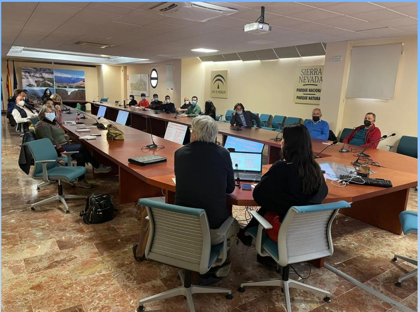
Participantes de la Jornada sobre Transición Energética

E l 25 de marzo tuvo lugar la I Jornada sobre sostenibilidad en Sierra Nevada dedicada a la Transición Energética, en el Centro Administrativo del Espacio Natural de Sierra Nevada.