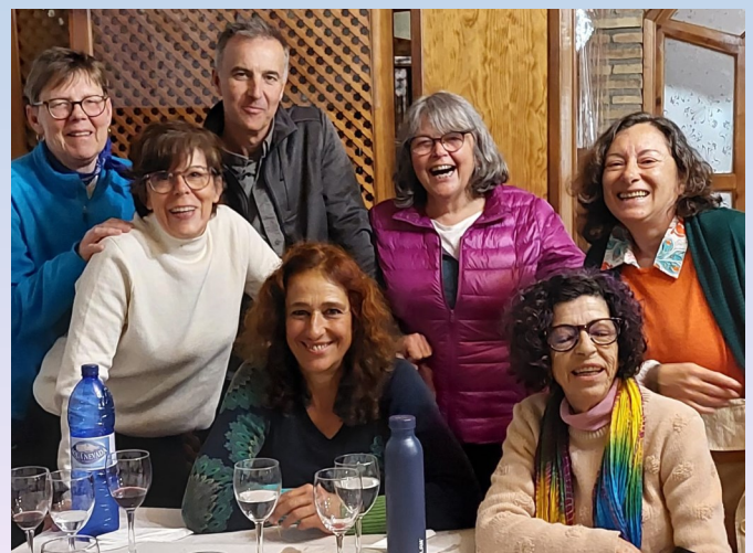
Participantes en el Foro CETS Sierra Nevada