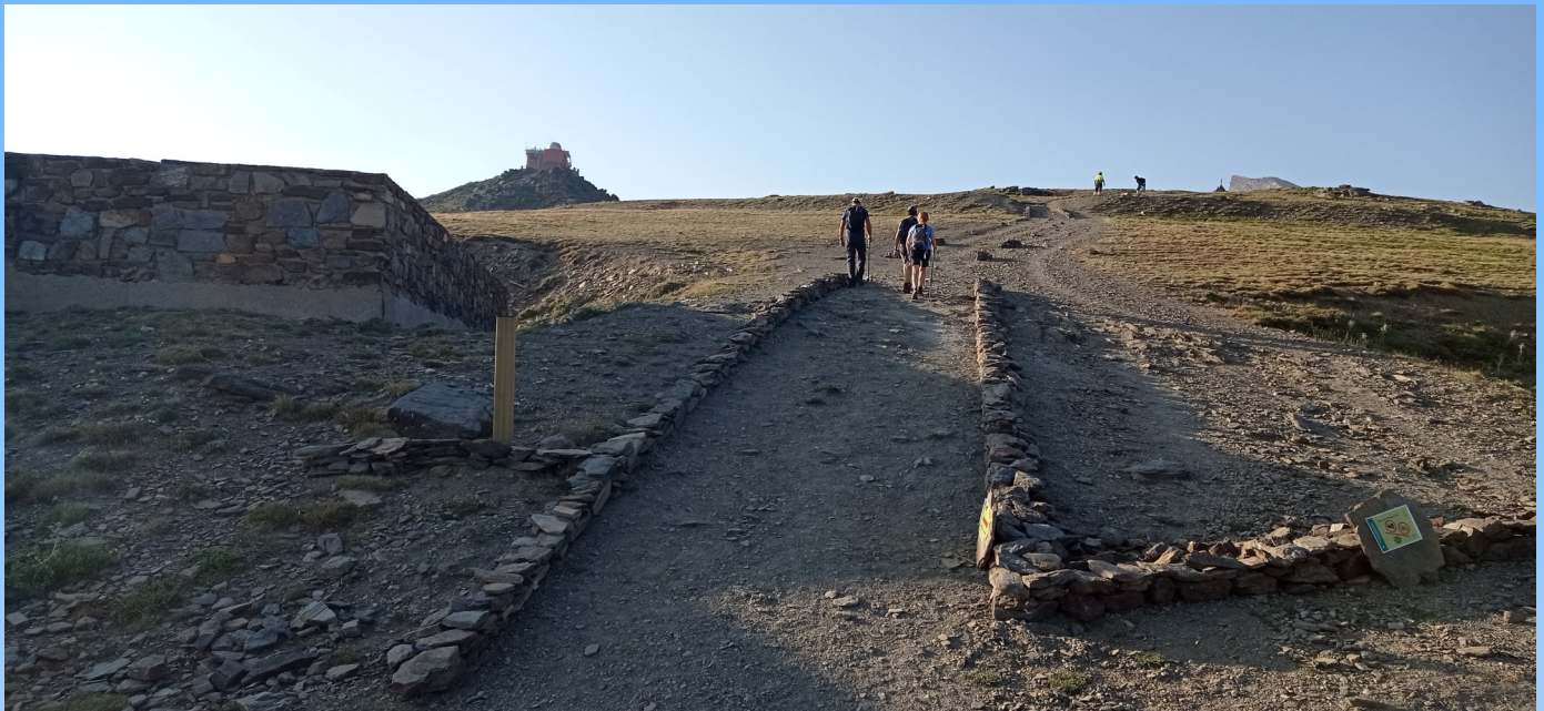
Acceso a la cumbre del Veleta

E l Pico Veleta es una de las cumbres más emblemáticas de Sierra Nevada y con el paso de los años son muchos los montañeros y turistas los que ascienden a su cima desde la Hoya de la Mora, lo que ha provocado la creación de sendas abiertas de forma espontánea con objetivo de reducir el trayecto y evitar la curvas de la carretera de acceso, caminos que erosionan y afean el paisaje.