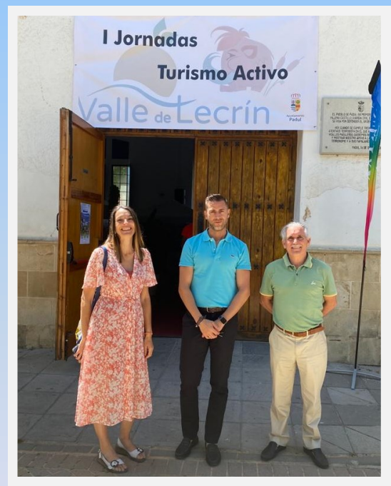
Personal del EN Sierra Nevada en las I Jornadas de Turismo Activo del Valle de Lecrín

para poder desarrollar el proyecto "Ecoturismo, una oportunidad de futuro en tu tierra".