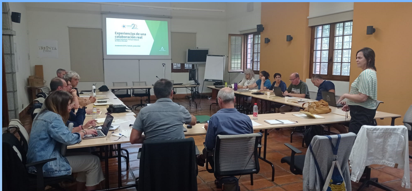
Participantes en el X Seminario de la CETS

D urante los días 8, 9 y 10 de junio, se celebró en CENEAM (Valsain) el X Seminario Permanente de la CETS, con una participación de 20 técnicos procedentes de espacios protegidos españoles acreditados con la CETS.