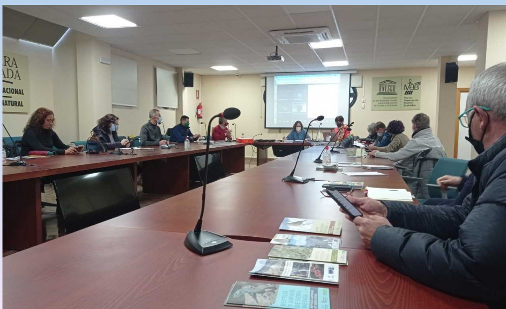
Participantes en el Foro Permanentes CETS Sierra Nevada

Se valora la organización del II Foro de Ecoturismo de Andalucía, con el objetivo principal de realizar un encuentro entre alcaldes/as