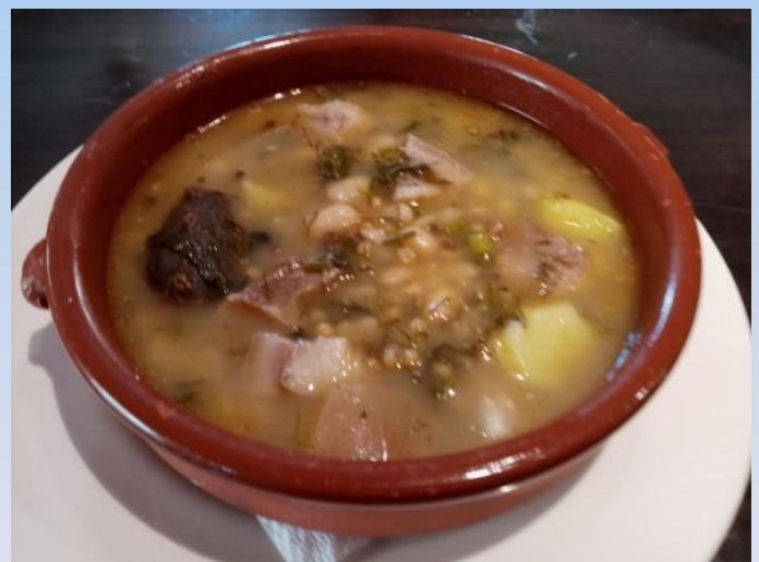
Potaje de hinojos

acompañan a legumbres y carnes; la ascendencia judía se refleja en la gran variedad de Potajes, como el famoso Potaje de hinojos , y la conservación de la succulenta repostería morisca, elaborada a base de almendra, miel y harina.