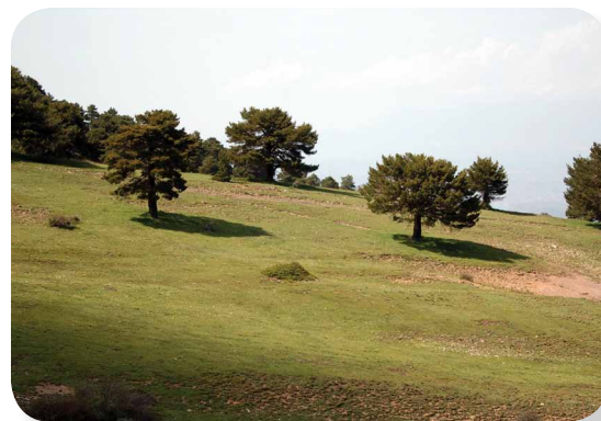
Los Prados del Rey están flanqueados de pinos silvestres

Mientras vamos ganando suavemente altura, podemos observar si en este prado alpino hay presencia de pequeñísimas lagunas o charcas, ya que el suelo propicia su aparición en los meses más húmedos, hecho este que nos regalara sin duda algunas bellas fotografías. De igual modo, es por ello que la riqueza