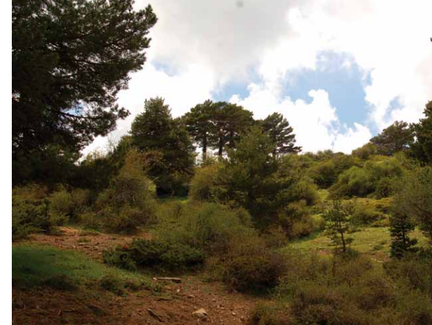
Bosque mediterráneo de alta montaña