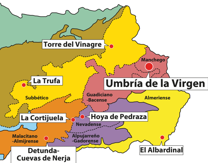
Distribución de los Jardines Botánicos de la Red Sectores Biogeográficos

La Red Andaluza de Jardines Botánicos en Espacios Naturales apuesta decididamente por el desarrollo y aplicación eficaz de la Estrategia Mundial para la Conservación de la Naturaleza y el Convenio sobre Diversidad Biológica. Como centros de conservación, recuperación y reintroducción de especies silvestres, la Red participa en la estrategia de conservación de esta Consejería y coordina sus actuaciones con otros organismos e instituciones regionales, nacionales e internacionales como la International Association of Botanic Gardens (IABG) o la Asociación Iberomacaronésica de Jardines Botánicos (AIMJB).