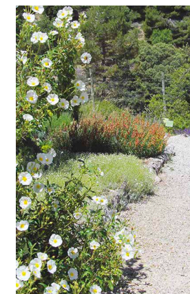
Plantas ornamentales silvestres