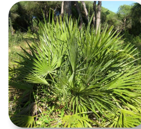
La única especie de palmera europea habita en estos parajes

pastores, o al lentisco, con propiedades medicinales, que buscan la sombra del pinar. En primavera, las jaras y jaguarzos nos brindan un espectáculo de color, y el aroma del cantueso o el poleo inundan nuestro olfato.