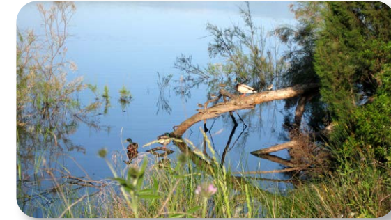
Gran cantidad de aves viven en las aguas de la laguna

en una zona algo más elevada desde la que podremos ver, entre los eneales y juncales, algunas de las aves que viven en el humedal como pollas de agua, calamones o ánades reales. También podremos observar el buceo, en busca de comida, de los zampullines chicos o el elaborado cortejo de los somormujos lavancos.