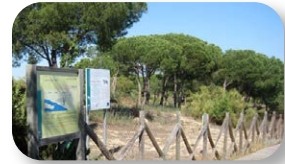
La evolución de la duna litoral fue el origen de la laguna

Iniciamos nuestro sendero en la misma orilla de la carretera (ver [1] en el mapa), cerca del mirador de la Laguna del Portil, en la zona suroeste de la laguna, por una pasarela de madera que parte hacia la derecha y que nos ahorra las dificultades que entraña caminar por las arenas.