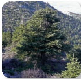
Desde el inicio del recorrido se atraviesa un pinsapar en buen estado de conservación, en el que aparecen pies aislados de pino carrasco y rodales repoblados con pino silvestre.

Inmediatamente nos adentramos en un bosque de pinsapos que nos acompañará hasta aproximadamente la cota 1.500 m. A partir de esa zona es sustituido por especies más adaptadas a la altitud y, sobre todo, la exposición al sol.