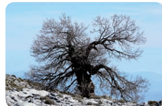
Cuando alcanzamos cotas de alta montaña aparecen pies aislados de quejigos.

Cuando alcanzamos el Puerto del Cuco [4] a 1.525 metros, comenzamos a divisar el Peñón de los Enamorados. Atrás van quedando los últimos pinsapos y aparece el matorral tapizante, conforme nos adentramos en la zona de los "ventisqueros".