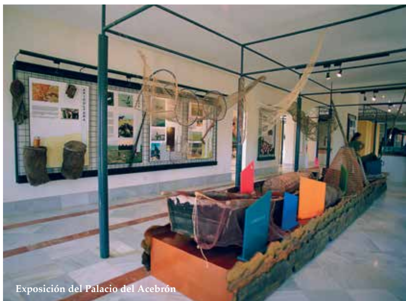
Exposición del Palacio del Acebrón