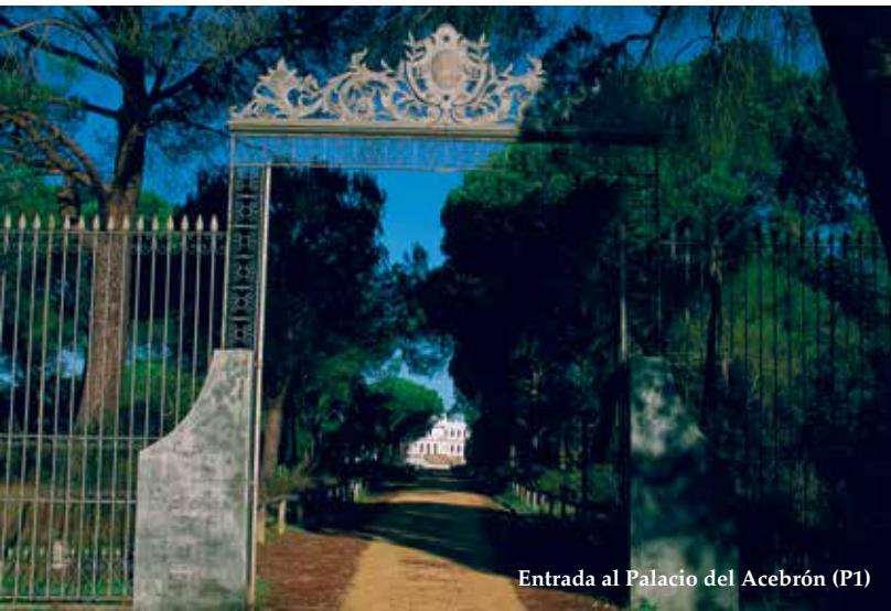
Entrada al Palacio del Acebrón (P1)