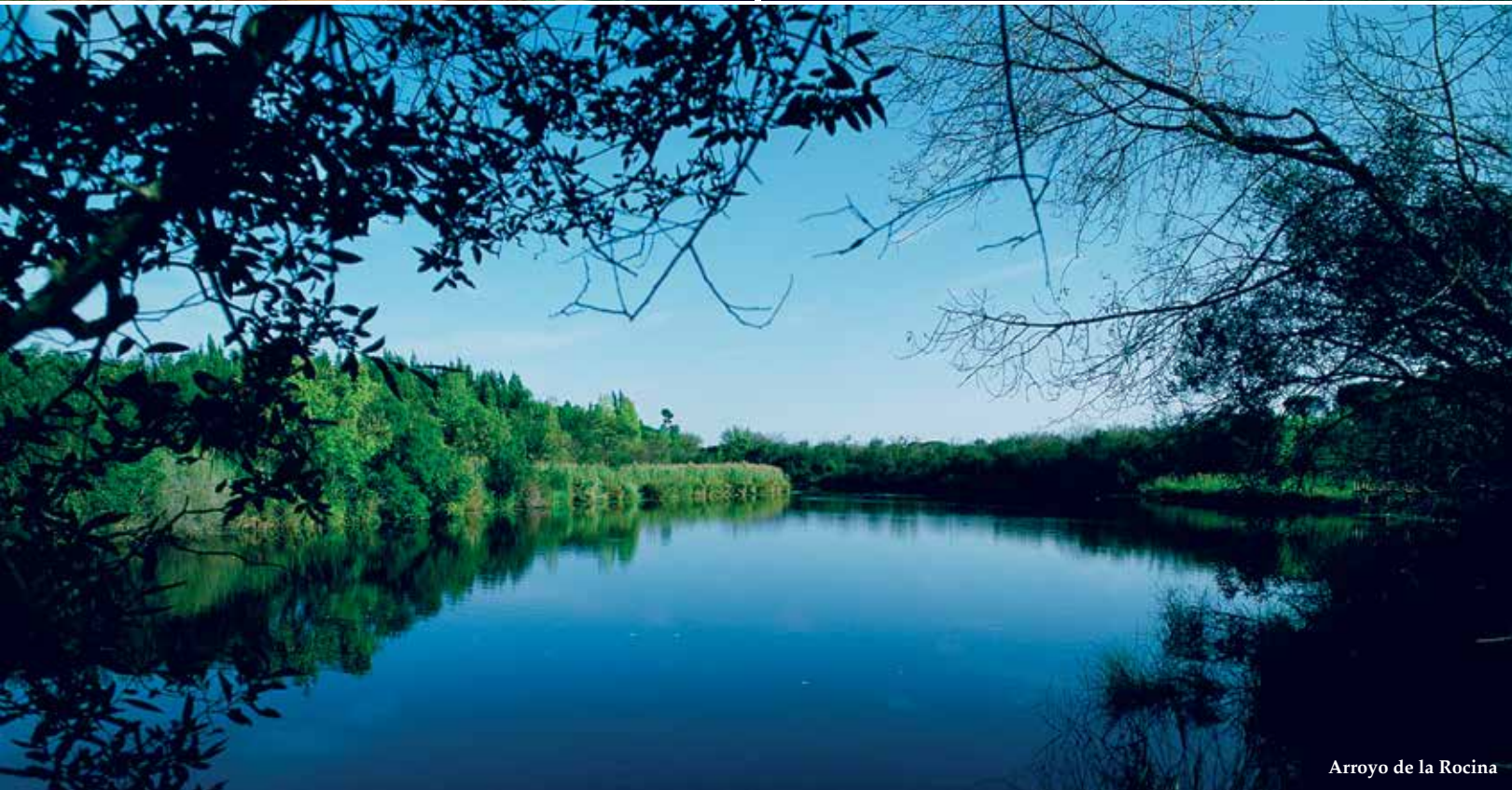
Arroyo de la Rocina