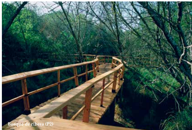
Bosque de ribera (P2)

Realizar este sendero en diferentes estaciones a lo largo del año, ya que cuenta con vegetación de hoja caduca y zonas encharcables que hacen muy diferente el paisaje según el periodo del año en que se visite.