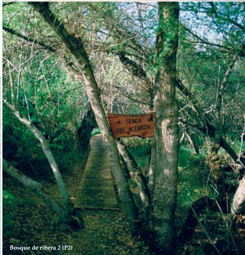
Bosque de ribera 2 (P2)