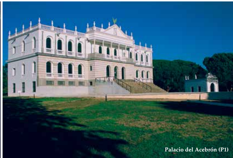
Palacio del Acebrón (P1)