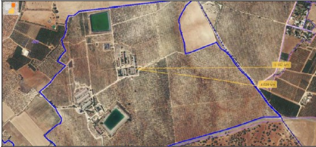
Detalle de distancia superior a 1.000 m de edificaciones en núcleo urbano (Imagen de Catastro)

Rogamos pues que en consonancia con el resto de instalaciones similares en esa Delegación Territorial se exima de la obligatoriedad de disponer de un Plan de Gestión de Olores y Ruidos a la instalación Las Beatas.