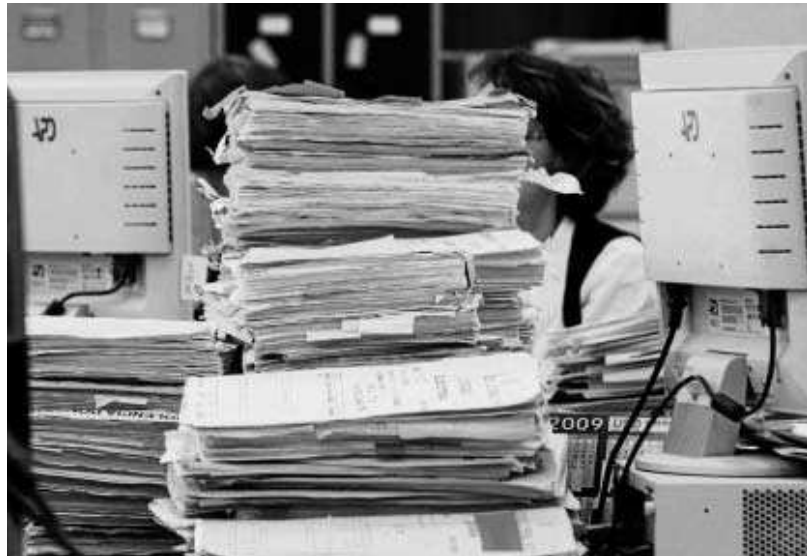
Decenas de expedientes se acumulan sobre el escritorio de un órgano judicial

En otros casos, incluso, las comunicaciones no han llegado a