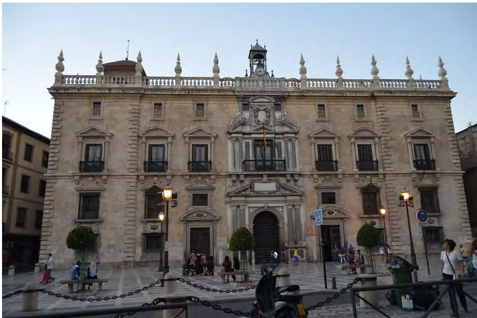
Sede del Tribunal Superior de Justicia de Andalucía, Ceuta y Melilla en Granada.

El Tribunal Superior de Justicia de Andalucía es el órgano jurisdiccional en que culmina la organización judicial en Andalucía.