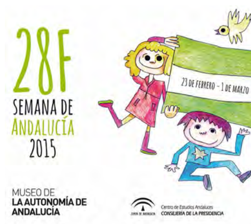
Cartel del Museo de la Autonomía de Andalucía. Coria del Río (Sevilla).