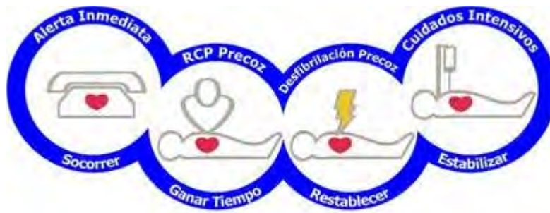
Figura nº 1.- Ilustración de la Cadena de Supervivencia